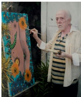
Chaple y "Delicta Carnis"

Después del primer encuentro es difícil partir. La maestría de las líneas invita a lo implacable. Cuerpos apretados entre las hojas selváticas de una naturaleza naciente. Serpiente y deseo de lo prohibido. El día del pecado junto a nuestros pies. El