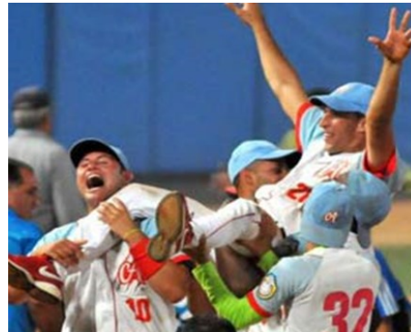
Los Tigres de Ciego de Ávila

Pero la alegría en el banco pinero logró poco, pues en la parte baja de esa entrada los Tigres le fabricaron otras dos frente al