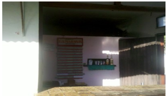
Cafetería "La Naranja"

"He ido varias veces al municipio para ver lo del refrigerador, pero me dicen que el problema es de fuga de gas en la caja de refrigeración y que se demoran en arreglarlo. No queda más remedio que vender productos, como refrescos y cervezas, calientes; además, cuento con una sola nevera y está en la administración. Allí, guardo los embutidos y cárnicos, pero como todos saben hay mercancías que al estar mucho tiempo congelada pierde calidad", dijo el administrador de la cafetería.