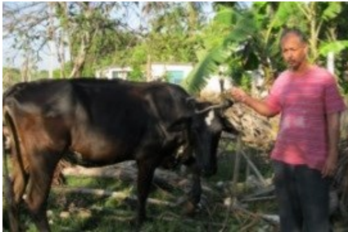
La vaca de mi vida

En este dilema masivo, que precipita desde una regulación absurda y desfasada en tiempo, no así en espacio, sufren muchas aristas. El campesino debe dormir con parte del ganado dentro de la casa; o lo que es conocido como “séptimo cuarto del bohío”.