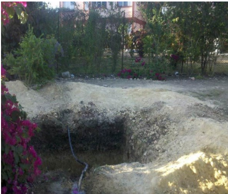
Una de las acciones de destupición

nes para su uso. Por otro lado, era un hábito archivar la demanda ciudadana en actas irrisorias que se engavetaban. Siempre, con la respuesta de que el Gobierno Municipal no contaba con presupuesto para acometer la reparación.