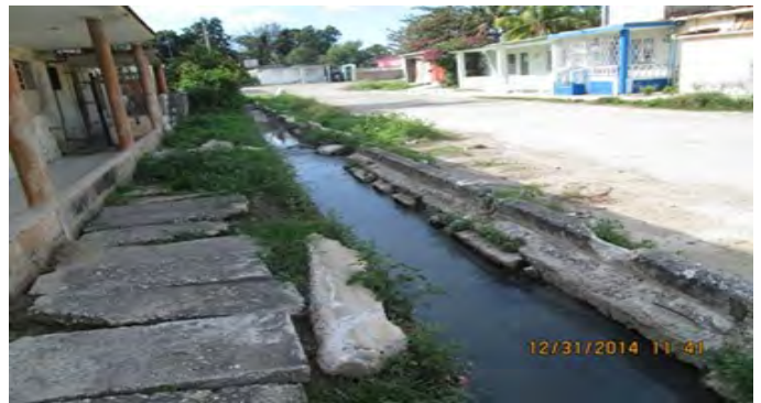
Aguas albañales en la calle