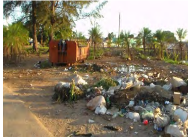
Derrame de basura

"Dicen que esto es una ciudad. Vivimos dentro de la basura. Pasa por el lugar pueblo, pasa por el lugar dirigente y nadie se conmueve. Es verdad que hay personas indolentes que sueltan la basura donde les parece, pero no es todo el mundo. ¿Dónde están los inspectores?, ¡que hagan su trabajo! No basta con poner multas a los viejitos que venden jabas. O, que se lleven en contenedor para otro lado", enfatizó una vecina.