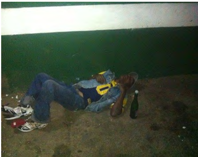
Ciudadano durmiendo en el CUPET del centro de Artemisa.