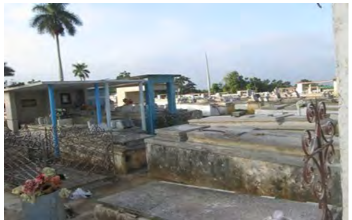
Cementerio del Poblado Candelaria