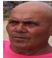
Por: Laudelino Pérez Cubano de a pie

Santa Clara, (ICLEP). Unos tres mil habitantes del reparto Camacho perteneciente al municipio de Santa Clara, no pueden comprar viandas y productos cárnicos, porque las autoridades de acopio decidieron no abastecer más al mercado de la localidad y agrupar los productos en otro establecimiento.