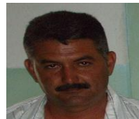
Por: Miguel Machado Cubano de a pie