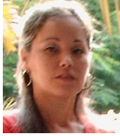
Por: Leticia Torres Cubana de a pie