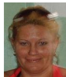
Por: Migdalia Suarez Cubana de a pie

Santa Clara, (ICLEP). Un grupo de jóvenes menores de veinte años residentes en Santa Clara, lanzaron piedras a un ómnibus Diana que cubría la ruta 5, causando heridas leves a cuatro personas y algunos daños de consideración al vehículo.