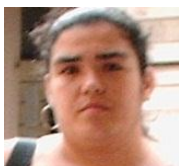
Por: Alejandra Suarez Cubana de a pie

Santa Clara, (ICLEP). La ausencia de condones desde hace alrededor de dos meses en la red provincial de farmacias y otros puntos de venta autorizados para su comercialización, vuelve a preocupar a la población de la provincia de Villa Clara.