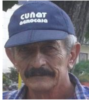
Por: Mauricio Suarez Cubano de a pie

Santa Clara, (ICLEP). Unos veinte campesinos pertenecientes a cuatro cooperativas agrícolas del municipio de Santa Clara, fueron perjudicados por la Empresa Acopio, la cual les rechazó más de quince toneladas de frijoles negros contratadas desde el año pasado y que estaban listas para su venta.