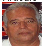
Por: Manuel Brito Cubano de a pie