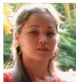
Por: Leticia Torres Cubana de a pie