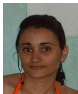
Por: Katia Pérez Cubana de a pie