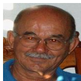
Por: Santiago González Cubano de a pie