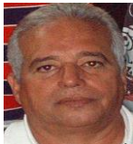
Por: Manuel Brito Cubano de a pie

Santa Clara, (ICLEP). Un grupo de estudiantes, de la Universidad Central que iban para su centro de estudios, manifestaron su disgusto ante los inspectores del punto de recogida de la carretera a Camajuaní, al ser ignorados por los chóferes de dos ómnibus pertenecientes a las Fuerzas Armadas que circulaban vacíos en esa dirección.