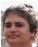
Por: Idalia Ruiz Cubana de a pie