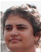
Por: Idalia Ruiz Cubana de a pie