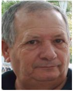
Por: Luis Morales Cubano de a pie

Santa Clara, (ICLEP). Unas semanas después de haberse anunciado en la radio oficial por funcionarios de la dirección de la Empresa de Ómnibus Urbanos, que las dificultades con el transporte que se presentaron durante la semana de receso escolar en el mes de abril ya estaban solucionadas, los residentes de Santa Clara mantienen la preocupación al observar como muchas de las rutas han disminuido la cantidad de viajes, afectando considerablemente el transporte de pasajeros.