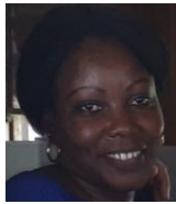
Por: Bárbara Cabrera Cubana de a pie

Santa Clara, (ICLEP). La falta de preocupación por parte de las autoridades del gobierno por las malas condiciones que presentan las tuberías del acueducto en los barrios de la ciudad, provocan que salideros de agua de gran envergadura afecten las calles y el paso de los ciudadanos.