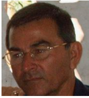
Por: Fidel Sánchez Cubano de a pie

La historia de las peleas de gallos se remonta a miles de años atrás en el tiempo, a la época antes de Cristo. Según estudiosos del tema en algunos países estas aves eran y aún hoy en día son objeto de adoración, por lo que se les considera sagradas y por ninguna circunstancia se les mata o se les hace daño.