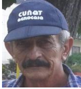
Por: Mauricio Suarez Cubano de a pie