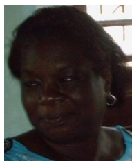
Por: Iraida Sarmiento Cubana de a pie

Santa Clara, (ICLEP). Un grupo de más de treinta personas que se encontraban en una cola para comprar espaguetis en el punto de venta del kiosco de la Cadena Caribe ubicado en el poblado de Manajanabo, terminaron enfrentadas en una riña que necesitó la intervención de