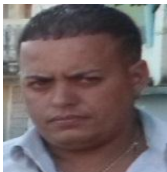
Por: Yosvani Ferrer Cubano de a pie

Santa Clara, (ICLEP). Un grupo de vecinos de la ciudad, expresaron su preocupación ante las autoridades del gobierno que los representan, motivados por el incremento de sucesos violentos que se han visto por estos días en la ciudad cabecera provincial.