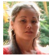
Por: Leticia Torres Cubana de a pie

Santa Clara, (ICLEP). La población de la ciudad mantiene la preocupación por la escasez e insuficientes cantidades de aceite para comer, que se venden en los diferentes puntos de la red de tiendas en divisas.