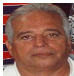
Por: Manuel Brito Cubano de a pie