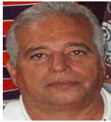
Por: Manuel Brito Cubano de a pie

Santa Clara, (ICLEP). Un grupo de empresas de la principal ciudad del centro del país, decidieron liberar a sus trabajadores y pagarles el día durante la visita gubernamental que realizara el Consejo de Ministros a la provincia de Villa Clara.