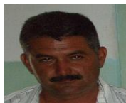
Por: Miguel Machado Cubano de a pie