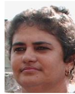
Por: Idalia Ruiz Cubana de a pie