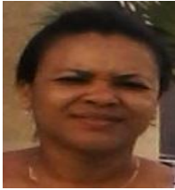
Por: Anay López Cubana de a pie

Santa Clara, (ICLEP). El Centro Provincial de Higiene y Epidemiología, ha informado públicamente y ha emitido una alerta oficial sobre la presencia del peligroso Caracol Africano Terrestre, en tres municipios: Santa Clara, Caibarién y Placetas, siendo éste último donde existe mayor infestación.