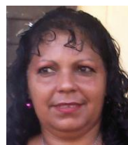
Por: Omara Pentón Cubana de a pie

La fábrica no obstante ha anunciado por la prensa oficial en reiteradas ocasiones, que prevé sustituir la entrega de leche en polvo por la fluida para finales del presente mes. Muchos pobladores se preguntan e imaginan el caos que vendrá, porque cuando tenían los equipos funcionando todo era una locura y el alimento llegaba a las bodegas de noche y a veces ni llegaba.