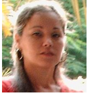
Por: Leticia Torres Cubana de a pie

El amor y el deseo de proteger a los animales, han unido a un grupo de personas que poco a poco van ganando el respeto y la consideración de todos los residentes de la ciudad de Santa Clara.