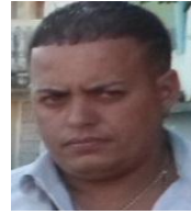
Por: Yosvani Ferrer Cubano de a pie