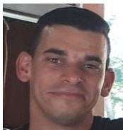
Por: Alain Izquierdo Cubano de a pie

Santa Clara, (ICLEP). Pobladores de la ciudad, miran con preocupación cómo las reparaciones que se realizan a la planta procesadora de productos lácteos provincial, se extienden por mucho más tiempo del que se previó y se comunicó por la prensa oficial.