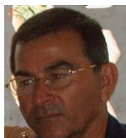
Por: Fidel Sánchez Cubano de a pie

Santa Clara, (ICLEP). Trabajadores y pacientes que asisten a un consultorio médico de la familia, ubicado en la calle Julio Jover entre Máximo Gómez y Juan Bruno Zayas, se quejan por el mal olor que hay en el mismo cada vez que viene el agua por el acueducto.