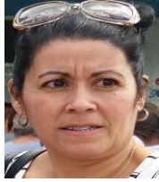
Por: Lucía Alvarado Cubana de a pie

Santa Clara, (ICLEP). Padres de alumnos que culminan la secundaria básica en el presente curso escolar, dijeron estar preocupados porque sus hijos no puedan recibir todo el contenido, debido a que no tienen profesores que se los impartan.