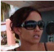
Por: Vivian Solís Cubano de a pie

Santa Clara, (ICLEP). El incremento de las citas informales entre jóvenes, coordinadas a través de las redes sociales, está provocando preocupación en muchos padres y familiares, que observan como sus hijos cambian frecuentemente de pareja, se relacionan y confían en personas totalmente desconocidas.