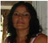
Por: Mercedes Torres Cubano de a pie

Santa Clara, (ICLEP). Autoridades de la Empresa de Productos Lácteos de la ciudad de Santa Clara, no repusieron las bolsas de leche cortada que recibieron en dos ocasiones cientos de niños menores de siete años, durante la pasada semana, debido según informaron a que los familiares de los mismos no reportaron en sus bodegas que el producto estaba en mal estado.