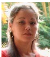
Por: Leticia Torres Cubano de a pie

Santa Clara, (ICLEP). Durante el primer mes del curso 2018 -2019 más de 80 maestros de las diferentes enseñanzas abandonaron las aulas en la provincia, cifra que constituye record para el territorio en un año lectivo, según comunicó un funcionario del Ministerio de Educación (MINED) solicitando anonimato.