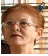
Por: Graciela Ramos Cubano de a pie

Santa Clara, (ICLEP). Más de dos mil estudiantes que comenzaron sus estudios en la enseñanza secundaria, no han podido comprar todavía sus uniformes escolares, debido a la inexistencia de los mismos en tiendas y puntos creados para su venta en la ciudad de Santa Clara.