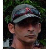
Por: Oscar Santiesteban Cubano de a pie

infestadas con parásitos, principalmente amebas".