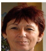
Por: Diana Silva Cubano de a pie

Santa Clara, (ICLEP). Las almohadillas sanitarias de la marca Mariposa que se venden racionadas a las mujeres que residen en las provincias centrales de Cuba y que están en edad reproductiva, cada vez vienen más finas y presentan una menor absorción.