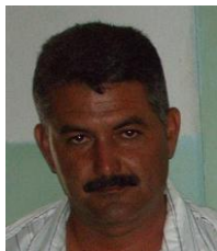
Por: Miguel Machado Cubano de a pie

Cada vez más personas manejan un negocio privado en Cuba, según datos oficiales el número de emprendedores ya supera el medio millón aunque la tasa de crecimiento ha disminuido considerablemente en el último año.