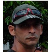
Por: Oscar Santiesteban Cubano de a pie

Santa Clara, (ICLEP). Un robo en la bodega nombrada El amanecer del Reparto Camacho de la ciudad de Santa Clara, ha provocado la indignación y el desconcierto de cientos de vecinos, que se ven imposibilitados de poder comprar sus alimentos desde hace varios días.