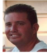
Por: Juan Carlos Gutiérrez Cubano de a pie

Santa Clara, (ICLEP). Una paciente enferma con dengue que ingresó en el Hospital Arnaldo Milán Castro de la ciudad de Santa Clara, falleció el pasado viernes a consecuencia de las complicaciones por la enfermedad, informaron especialistas que laboran en el mencionado centro hospitalario.