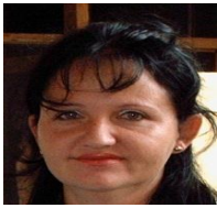
Por: Tania Puig Cubano de a pie

Santa Clara, (ICLEP). Un accidente de tránsito ocurrido el pasado día siete de noviembre en una zona de la carretera a Camajuaní conocida como la curva de comercio, en el que se vieron involucrados un auto lada del Minint y una camioneta del Ministerio de la Agricultura, dejó seis personas lesionadas.