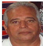
Por: Manuel Brito Cubano de a pie