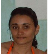
Por: Katia Pérez Cubana de a pie