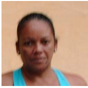
Por: Regla López Cubana de a pie

Santa Clara, (ICLEP). La calle sexta del barrio santacloreño conocido como Bengochea, se llena de agua sucia debido a las tupiciones en los registros destinados para el desagüe y a la gran cantidad de salideros en las tuberías encargadas de evacuar las aguas albañales de las viviendas allí ubicadas.