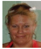
Por: Migdalia Suarez Cubana de a pie

Santa Clara, (ICLEP). Fuertes vientos producidos durante una tormenta local severa ocurrida el pasado día seis de febrero, produjo la caída de árboles además de importantes averías que afectaron el servicio eléctrico por más de veinticuatro horas en algunas localidades de la periferia, pertenecientes al municipio de Santa Clara.