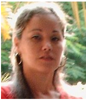
Por: Leticia Torres Cubana de a pie