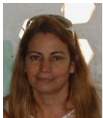
Por: Julia Claro Cubana de a pie