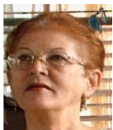
Por: Graciela Ramos Cubana de a pie

Santa Clara, (ICLEP). Un numeroso grupo de vecinos del Reparto Universitario en la ciudad de Santa Clara, reclamaron ante las autoridades gubernamentales que los atienden en el territorio, que los días cuatro, cinco y seis de febrero, recibieron el pan de la cuota con moho y endurecido.