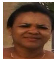
Por: Anay López Cubana de a pie

Santa Clara, (ICLEP). En lo que va de julio el Sistema de Atención Primaria del Consejo Popular Universidad, registra más de cincuenta casos de contagio de dengue y una cifra parecida de personas infectadas con Zika. El dato pudiera aumentar a medida que vayan saliendo los resultados de los análisis médicos, que les han sido practicados a más de cien personas con síntomas de la enfermedad.