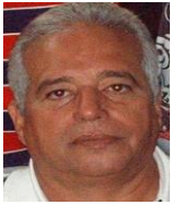
Por: Manuel Brito Cubano de a pie

Desde que se autorizó el derecho de ejercer el trabajo por cuenta propia, no ha cesado la vigilancia del gobierno hacia las personas que dignamente ejercen su trabajo en esa modalidad, es como un mal necesario que el Estado acepta pero que no lo asimila.