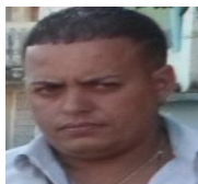
Por: Yosvani Ferrer Cubano de a pie

Santa Clara, (ICLEP). En estos últimos días con el inicio de la etapa de verano, se han incrementado los accidentes del tránsito en la ciudad, con un total de seis en menos de una semana, ya sea por negligencia de los chóferes o por el mal estado técnico de los medios de transporte y las vías.