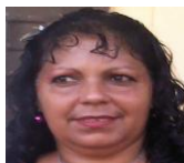
Por: Omara Pentón Cubana de a pie

Todos los aficionados y amigos del estelar pelotero que se encontraban presentes en el encuentro, abogaron por su pronta recuperación y le desearon éxitos en el futuro de su carrera.