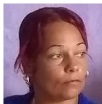
Por: Bertha Benítez Cubana de a pie