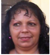
Por: Omara Pentón Cubana de a pie

Santa Clara, (ICLEP). En el punto de atención de seguridad social del consejo popular Chamberí-Hospital, varias decenas de pensionados mayores de 60 y 70 años de edad, esperan por varias horas bajo un sol candente e insoportable para recibir su chequera.