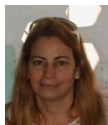
Por: Julia Claro Cubana de a pie

Santa Clara, (ICLEP). El problema de la desatención a la población, estuvo en el centro de los debates de la asamblea provincial del gobierno por estos días sin observarse una solución, según opinaron algunos participantes en los encuentros.