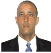
Por: Yordanis Alonso Cubano de a pie

Santa Clara, (ICLEP). Clientes de la Cadena Caribe que compran equipos electrónicos, se quejan de que los mismos cada vez son más caros, se deterioran rápidamente y poseen un servicio de garantía muy corto e ineficiente.