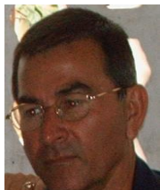
Por: Fidel Sánchez Cubano de a pie

Es más que sabido el problema que existe en Cuba con la acumulación de basura en lugares públicos ante la vista de todos. Hoy más que nunca es algo que se sale de lo normal, eso está ya muy evidenciado en esta gran ciudad de Santa Clara, que con sus miles de habitantes genera gran acumulación.