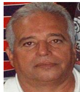
Por: Manuel Brito Cubano de a pie