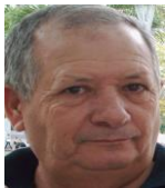
Por: Luis Morales Cubano de a pie

Santa Clara, (ICLEP). Las obras de remodelación de la carretera Central permanecen paradas desde hace más de un mes, dilatando las afectaciones al tránsito y a las personas que residen en ese lugar, según informan algunos de los afectados.