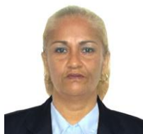
Por: Tania Águila Cubana de a pie

Santa Clara, (ICLEP). Muchos santacolareños pudieron observar como la verbena de la calle Gloria celebrada el pasado 12 de agosto, cada año pierde calidad y motivación en su preparación producto de la crisis económica y social que vive el país.