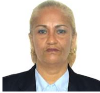
Por: Tania Águila Cubano de a pie

Santa Clara, (ICLEP). A solo un mes de iniciado el presente curso escolar 2019-2020 en Cuba, en la escuela primaria 28 de Enero de Santa Clara, ocurrió un hecho que demostró las mentiras que dicen los dirigentes del sistema totalitario que gobierna en Cuba.