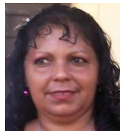
Por: Omara Pentón Cubana de a pie