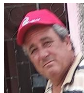
Por: Alcides González Cubano de a pie

Santa Clara, (ICLEP). Las autoridades del gobierno en el municipio cabecera provincial tomarán medidas enérgicas que pueden incluir la retirada definitiva de la licencia para desarrollar actividades por cuenta propia, con los choferes de motonetas que se nieguen a prestar servicios durante los días de agravamiento de la crisis energética que vive el país.