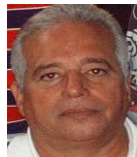
Por: Manuel Brito Cubano de a pie