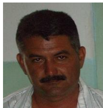
Por: Miguel Machado Cubana de a pie

Santa Clara, (ICLEP). Una riña entre choferes de camiones que permanecían en una cola para comprar combustible, se produjo el día tres de octubre en horas de la noche en el establecimiento que está ubicado en la autopista nacional y que todos conocen como el Servi del Camionero.