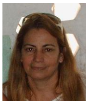
Por: Julia Claro Cubana de a pie

Santa Clara, (ICLEP). Un mes después de haberse iniciado el presente curso escolar, la escuela primaria Octavio de la Concepción de la Pedraja se encuentra invadida por pulgas, según informan sus trabajadores.