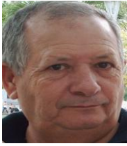
Por: Luis Morales Cubano de a pie

Santa Clara, (ICLEP). Lo anunciado por el Ministro de Energía y Minas en las mesas redondas en la televisión de que no existían problemas con la venta de gas y que los problemas con su transportación hacia los puntos de venta se normalizarían, no ha sido cumplido en los establecimientos de la ciudad de Santa Clara, según afirman sus clientes.