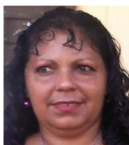
Por: Omara Pentón Cubana de a pie

Santa Clara, (ICLEP). El círculo infantil "Pequeño príncipe", del consejo Virginia, exactamente ubicado frente al correito de la carretera central, no tiene agua desde hace más de un mes ya que la turbina está rota y hasta la fecha ninguna pipa del Estado, ha acudido a llenar la cisterna y los tanques del mencionado centro.