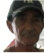
Por: Antonio Cárdenas Cubana de a pie

Santa Clara, (ICLEP). La mayoría de los vecinos que residen en el poblado de El Recanto muy cercano a la carretera a Sagua, se quejaron ante el delegado del poder popular que los atiende, por el pésimo estado en que se encuentran las calles de su comunidad.