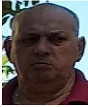
Por: Fernando Álvarez Cubano de a pie

La higiene en las calles de los barrios y repartos en una ciudad que ostentó el título de "Ciudad limpia" y fue referencia a nivel nacional hace algunos años, se ha convertido en un problema grave y es tema de preocupación de la mayoría de los ciudadanos que vivimos en ella.