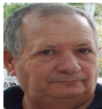
Por: Luis Morales Cubano de a pie