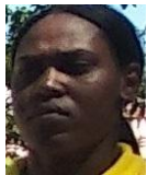
Por: Lázara Acosta Cubano de a pie

Santa Clara, (ICLEP). . Más de cinco horas demoraron los linieros de la Empresa Eléctrica en acudir a un círculo infantil, que tenía un cable de alta tensión caído y tirado frente a su puerta principal, causando gran peligro para todos las personas que pasaban por ese lugar e impidiendo la entrada y salida del mencionado centro, según cuentan testigos de lo sucedido.