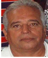
Por: Manuel Brito Cubano de a pie

Santa Clara, (ICLEP). A pesar de que el gobierno mantiene oculto el número de personas que fallecen a consecuencia del Dengue, la cifra continúa aumentando debido a la elevada cantidad de personas enfermas y a los altos niveles de infestación de mosquitos.