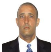
Por: Yordanis Alonso Cubano de a pie

La señora agradeció la ayuda de todos los vecinos del lugar que sin obligación y contrario al Estado, han gastado esfuerzos y proporcionado recursos en el beneficio de los menores.