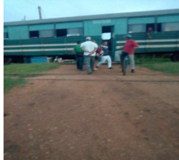
Parada del tren

Un sondeo periodístico arrojó que el inconveniente ha sido planteado. Hasta la fecha sigue sin solución, este viejo anhelo de la comunidad, distante a 3 kilómetros del municipio, que no requiere de presupuesto estatal, a grandes magnitudes. ¿Por qué entonces las autoridades y funcionarios del sector