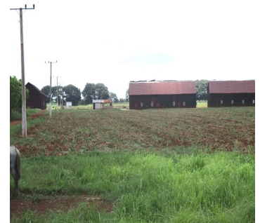
Empresa del tabaco

"El pretexto que buscaron esta vez para no pagarnos fue: incumplimiento con la producción y un faltante de dinero que hubo en el campo, por la compra de unos materiales. Nosotros pedimos que se nos pague el dinero de la estimulación, porque siempre cumplíamos con el plan establecido, 6 pacas diarias de tabaco por trabajador", denunció Rosa Hernández.