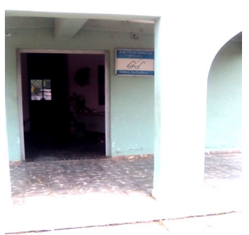
Óptica, municipio Los Arabos

El viernes 15 de julio la prensa ciudadana confirmó la presencia de los implementos en la entidad, ubicada en Calle Martí, entre Clemente Zenea y 5ta; donde de forma sistemática en meses anteriores fue evidente la escasez de: cristales, tornillos, terminales y plaquetas; la inestabilidad en las provisiones, las