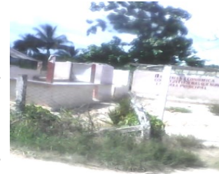
Círculo social destruido

comunidad, el conocimiento de un suceso, análogo al problema. Resulta que un trabajador por cuenta propia quiso rentar el local y funcionarios pertenecientes a los ramos de Cultura, Comercio y Gastronomía entorpecieron la gestión.