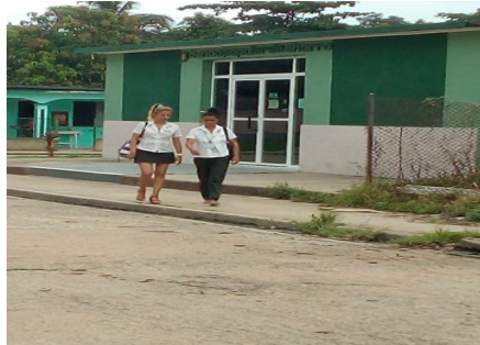
Banco, Los Arabos