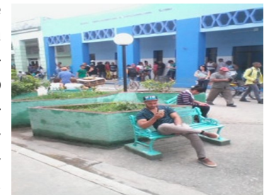
Zona Wifi, Colón