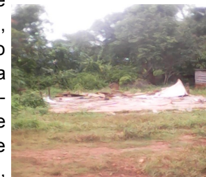
Ruinas de la casa

“Desde que hablé con Anselmo ya pasó un año y continuo en las mismas. Por aquí también vinieron los trabajadores sociales, con el cuento de que me iban a dar un subsidio, pero eso tampoco aparece y yo no tengo dinero para asumir la construcción de la casa. Yo espero que la revolución no me deje desamparada, porque siempre he sido revolucionaria”, expresó Lucrecia .