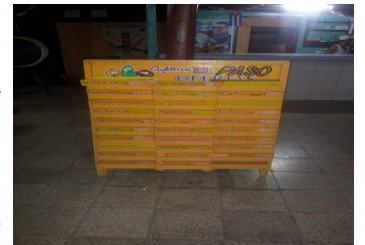
Cafetería El Paso

En medio de la crisis alimenticia que se manifiesta en el territorio, lo contrasentido del asunto, es la oportunidad que desestima el sector de establecer valores de equilibrio en correspondencia al parámetro oferta y demanda, aprovechando la posición geográfica y las características particulares del lugar, que otra época brindara un servicio de excelencia.