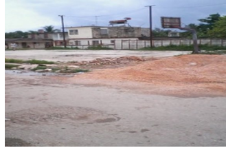
Cancha de baloncesto

Dentro de 15 días comenzarán las clases en el país y aún permanece sin una señal de tránsito, que recuerde a los choferes de vehículos, que circulan por las inmediaciones del instituto preuniversitario José Antonio Echeverría, la presencia de este centro de enseñanza; a pesar de que han ocurrido eventos donde solo la fortuna ha librado de la amenaza de ser atropellados a los adolescentes y niños que practican deportes, en la cancha de baloncesto del recinto educativo. Durante las múltiples escapadas de las pelotas en este perímetro no delimitado, el peligro acecha a los infantes y jóvenes. El viernes 19 de agosto, a las 4:40 pm, solo una manipulación diestra y un dominio seguro del volante, esquivó a un menor que obstruyó el paso vehicular, mientras corría detrás de un balón. El hecho no tuvo consecuencias para la vida del niño, ni para el conductor a bordo de la máquina.