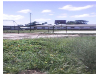
Escuela Felino Álvarez

“La cubierta que hace falta para el comedor existe en la provincia, pero el sector no tiene presupuesto para ad-