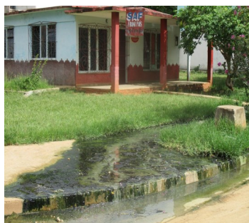
Fosa cercana al recinto