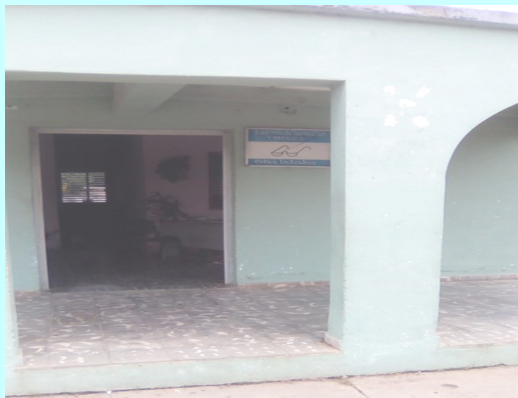
Óptica, Los Arabos

El pueblo cubano no merece tantos vejámenes; ni vivir sometido en una olla de presión. Las calles son lugares de encuentros, saludos, de respirar gente buena y humanidad. Pero si son las calles del pueblo natal, donde hay una iglesia y un perdón, entonces qué más vale no escondernos en las casas y conquistar lo que por derecho de nacimiento y honradez nos pertenece.