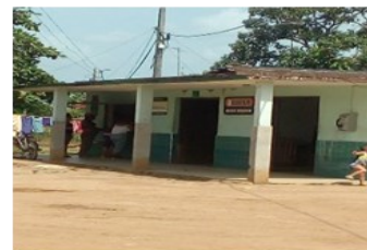
Bodega ,Cuatro Esquinas