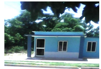
Terminal de ómnibus