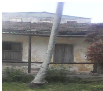
Vivienda donde se cometió el robo

“Las ilegalidades campean por su respeto en el batey. Ya no se hace la guardia de los CDR (Comité de Defensa de la Revolución) y continúa en desuso el local que funciona como sector de la policía, donde no existe un agente del orden que trabaje de manera diaria, por eso las cosas van de mal en peor”, aseveró una víctima que optó por el anonimato.