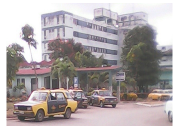
Servicio de taxis

“Cuando me dirigí a uno de los taxis que permanecía de guardia para trasladarme a mi domicilio, a dos kilómetros de la ciudad. El chofer me dijo, que el jefe de turno del hospital era quien autorizaba la salida. Cuando por fin logro dar con el trabajador, quien no se encontraba en su centro de trabajo en pleno horario laboral, me trató muy mal; me gritó lo de la falta de combustible, alegando que los taxis eran para pacientes que finalizaban su estadía en el centro. No tuvo en cuenta mi discapacidad, lo difícil que era para mí buscar un medio de transporte, a esa hora de la noche. ¡Hasta cuándo tendremos que soportar tanto atropello!”.