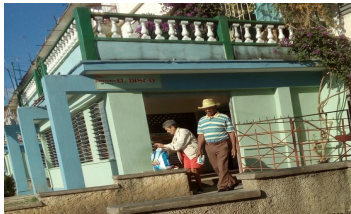
Cafetería “El Disco”

entidad Comercio y Gastronomía, se encuentra ubicada en el reparto Camilo Cienfuegos, Calle # 1, Los Arabos. Según los testimonios recogidos, la situación que viene manifestándose en el lugar, desde mayo del 2016, incluye también, falta de higiene en los vasos y pésima calidad de los comestibles y jugos.