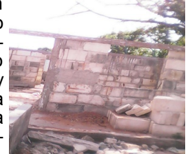
Vivienda en construcción