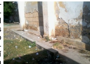
Exterior de la iglesia, en el suelo orina y excrementos

Colón, Matanzas. De insoponible califican devotos de la iglesia católica en la ciudad, el mal olor que expiden las paredes exteriores del templo, utilizado como baño público por ciudadanos irrespetuosos que hacen allí sus necesidades fisiológicas, sin ningún pudor y a la luz del día. De forma generalizada la comunidad cristiana ha expresado sus reclamos a las autoridades, pero aún continúa el inconveniente.