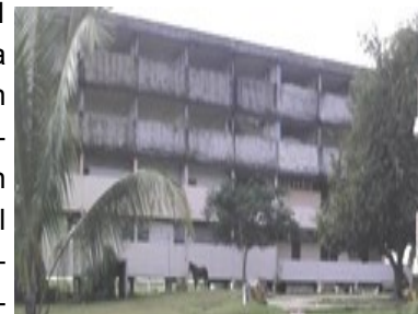
Politécnico Julio Padrón

Colón, Matanzas. Ante el peligro que representa para los estudiantes la estadía en uno de los edificios del Instituto Politécnico Julio Padrón Armenteros, directivos del ministerio de educación decretan su clausura total, como consecuencia del deterioro paulatino de la instalación.