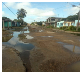
Calle 24 de febrero

En la edición 10 de este boletín, varios lugareños compartieron indignados ante la nula gestión estatal que propiciaba la presencia de aguas albañales en esta senda, procedente de la fosa de un consultorio médico cercano. En la actualidad ya no es el vertimiento quien obstaculiza el paso a autos y peatones, sino las graves dificultades que presenta esta calle ya reparada.