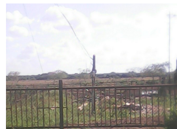
Escombros del derrumbe

Hoy reside en un pequeño cuarto que le prestó un amigo; de su casa, ubicada en la Finca Souvenir, Carretera San José de los Ramos, municipio Colón, solo quedó en pie el poste donde radica el contador, que medía el consumo eléctrico de la morada; en ruinas en la actualidad.