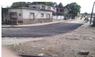
Calle Juan Clemente Zenea

Tras la gestión de la prensa ciudadana y en respuesta a los reclamos de los aquejados, el lunes 23 de enero, comenzó el proyecto que completó la reparación de la conductora fragmentada. En los trabajos, también participó la empresa Viales, ejecutando el asfaltado de esta arteria, cuya situación insalubre constituía tema de debate público. El hecho acaparó la atención social del vecindario, célebre por el mal estado que ostentaba la vía.