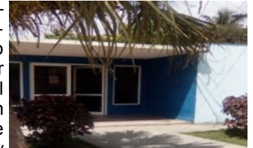
Joven Club de Computación, Los Arabos

Los Arabos, Matanzas. Abandona el Joven Club de Computación y Electrónica su objeto social, luego 30 años de brindar servicio con un marcado perfil comunitario, desempeñando un papel importante en la vida de varias generaciones de niños y jóvenes, la entidad priva a los infantes de escasos recursos, de jugar el video juego en la red, conocido como WOW, dada el alza de su tarifa.