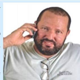
Por: Arévalo Padrón

Es consabido, que la sensación de miedo en los seres humanos no siempre puede asociarse con un antiviral; el exceso, ya es otra rama del mismo árbol. El temor a algo, en diversas y muy particulares ocasiones, a veces funciona como mecanismo de defensa o tónico de precaución. Pero lo que no hiere no mata, anda por el mundo de forma paralela. Si estamos tan seguro de algo, por qué la demasía en prevención; que como indica la lógica y presencia, ya no podemos catalogar el nuevo estadio de simplemente “miedo”, sino de abundancia de este. Y eso, según la compilación Cervantes, en pánico. Definido como miedo grande e injustificado.