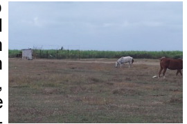
Campo de béisbol

Los Arabos, Matanzas. Un terreno designado para la práctica de béisbol y fútbol se encuentra abandonado en el distrito municipal. El espacio en forma de cuadrado y césped natural, conocido como "El béisbolito", fue objeto de un robo en su infraestructura; desde entonces, permanece desatendido, señalaron varias personas aficionadas a la práctica de ambas modalidades deportivas. El área se encuentra convertida en un potrero, este martes 24 de enero; es visible la presencia de más de un equino en el cuadrante, sin presupuesto y acciones inmediatas que propicien su rescate.