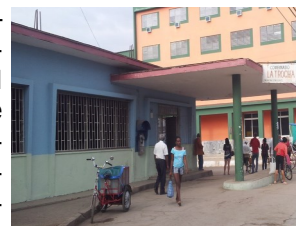
Bodega "La Trocha"

Colón, Matanzas. Críticas generalizadas manifiestan los consumidores a cerca de la mala calidad del arroz, expedido por la libreta de racionamiento en el municipio, durante este mes de enero. Los reclamos en las bodegas están relacionados con la basura y los olores desagradables que expide el cereal.