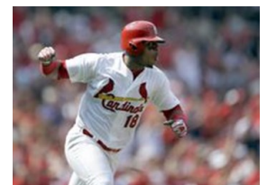
Pelotero Oscar Taveras

De acuerdo al informe, ambos viajaban en un Chevrolet Camaro que se deslizó el domingo en medio de la lluvia.