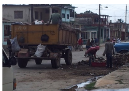
Brigada de comunales