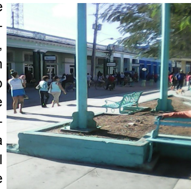
Zona wifi Boulevard Colón