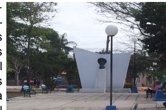
Parque Camilo Cienfuegos, Los Arabos