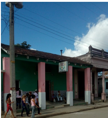
Panadería La Cadena