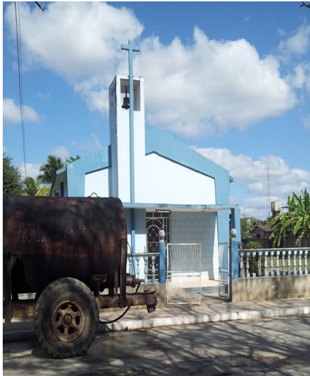
Iglesia Episcopal, Los Arabos

Por otro lado, muchas son las opiniones que reflejan su desacuerdo con el proceder del funcionario, que cuenta con pocos seguidores dentro del ámbito municipal, quienes alegan que durante su mandato se acentuado la corrupción y la crisis económica- social en el territorio, debido a su larga administración y las características controvertidas de su mandato. Hoy, más que nunca, Viera Prats es polémica en Los Arabos .