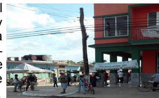
Inauguración, Hotel Caridad

Según la trabajadora consultada, el proyecto de restauración, contó con un presupuesto solicitado al departamento de inversiones de la Empresa Provincial de Gastronomía. La obra fue asumida por una cooperativa de trabajadores por cuentapropistas