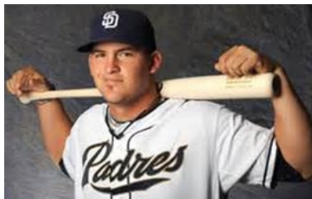
Pelotero de grandes ligas

El cubano Yasmani Grandal, receptor de los Dodgers de Los Ángeles, fue seleccionado por primera vez para el Juego de Estrellas que se realizará el 14 de julio en Cincinnati, reporta la AP. Grandal será el tercer pelotero que participará en el duelo de este año tras purgar una suspensión a raíz de la pesquisa de la organización de Grandes Ligas sobre la clínica Biogénesis of América. Nelson Cruz, toletero dominicano de Seattle, y su compatriota Jhonny Peralta, campocorto de San Luis, fueron elegidos por los fanáticos como titulares. Menos de tres meses después de debutar en las Mayores, el antesalista Kris Bryant, de los Cachorros de Chicago, será también parte del Juego de Estrellas, como uno de dos novatos elegidos el lunes, junto con Joc Pederson, jardinero de los Dodgers de Los Ángeles. No hubo espacio en el grupo de suplentes para Alex Rodríguez, pese a su resurgimiento con los Yan-