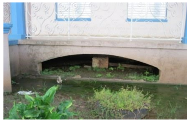
Guardería Amanecer Feliz