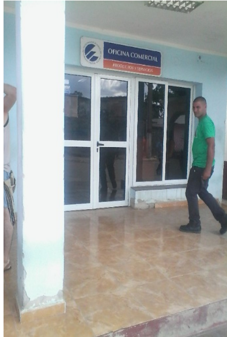
Oficina comercial de ETECSA, Los Arabos