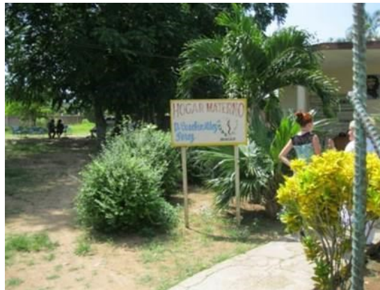
Hogar materno del municipio Colón

embarazo y en este centro siempre han ocurrido estos sucesos. Esta vez, la víctima fue una embarazada que se encontraba interna por minoría de edad y bajo peso. A la muchachita le robaron 40 pesos moneda nacional y alimentos". Y agregó: "Las taquillas del centro no tienen seguridad y sólo tenemos un refrigerador para guardar los alimentos de todas. No es la primera vez que esto sucede. En nuestro estado, nos pasamos la noche en vigilia".