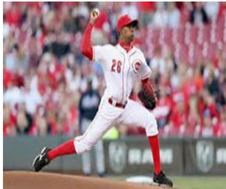
Pitcher cubano Raisel Iglesias

Los Mets (62-52) igualaron su mejor nivel de la temporada con 10 juegos sobre el promedio de .500. DeGrom (11-6), Novato del Año de la Liga Nacional la temporada pasada, terminó con el octavo juego