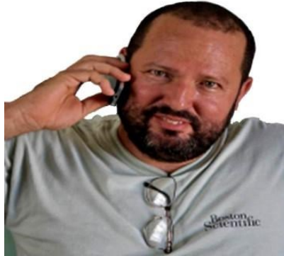
Por: Bernardo R. Arévalo Periodista ciudadano

mocles para el régimen. Porque hay un momento donde los cuentos se agotan y la gente continúa ahí; esperando que un día el país mejore y que se cumpla con el cacareado principio de que “todos somos iguales”. Precepto que ya ni ellos mismos se creen, cuando adoptan formas desesperadas para mantenerse en el poder.