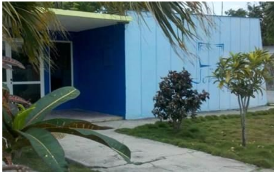
Joven Club de Computación y Electrónica

para poder entrar y coger una máquina. Ahora, mi nieto me cuenta que la cosa es muy diferente. También, le pusieron a los laboratorios aires acondicionados. Eso sí, que es una mejora tremenda porque estar metido en un cuarto cerrado sin aire, no había quien lo aguantara".