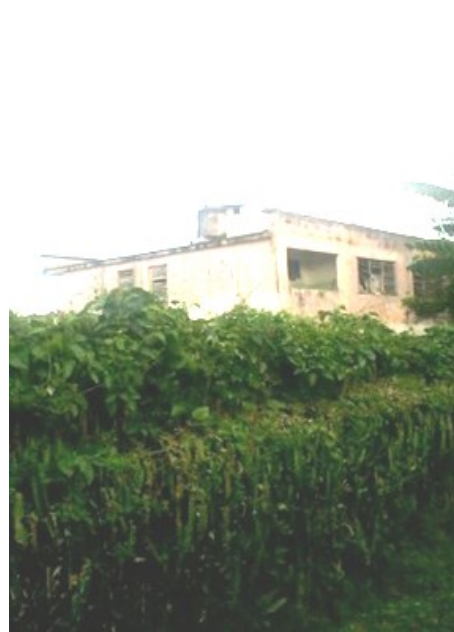
Consultorio médico de Macagua

Es inaplazable, por la distancia de la comunidad con la cabecera municipal, contar con un facultativo en el poblado durante el horario nocturno y