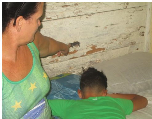
Orificio de salida, justo encima de la cama