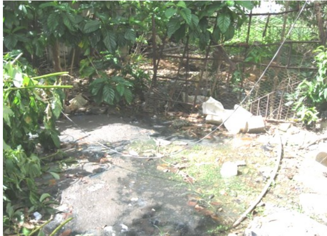
Fosa que vierte los desechos al exterior