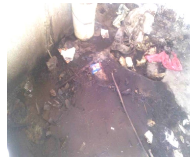
Foto del baño, en el mes Abril

Un muchacho expresó: "Ya me voy porque la gente del gobierno se va demorar en venir. Mañana voy a venir. Si la respuesta que me dan no es la más adecuada voy a verla usted. ¡Ahora, yo sí sé que ustedes se meten en la caliente!".