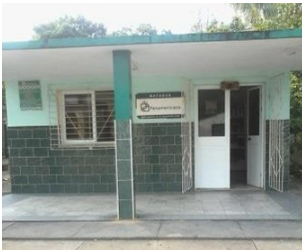
Tienda panamericana en la comunidad Macagua

Los Arabos, Matanzas. En el ejemplar impreso # 8, correspondiente al 15 de junio, de la publicación social Cocodrilo Callejero, se hizo alusión al desabastecimiento de productos como: perfumes, cigarros y víveres que exhibía la Tienda Panamericana, referente a la Red Minorista de la Corporación CIMEX, en la comunidad Macagua. La prolongada ausencia de las ofertas en el establecimiento desmiente la eficiencia de la cadena comercial.