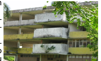
Escuela Roberto Coco Peredo

"Repararlo no es tarea de meses, es una obra que requiere años. Duele ver este lugar que brilló antes. Dormitorio, aulas, biblioteca, enfermería, peluquería en la actualidad no son más que locales desmantelados", afirmó en entrevista concertada, el día 26 de agosto, un miembro del consejo de dirección, quien pidió no revelar su identidad.