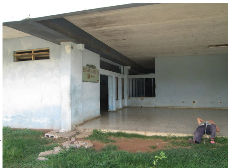
Terminal de ferrocarriles

"No es el hambre ni las malas noches, morir de frío en este lugar es mi mayor miedo", confesó Mesa, quien pidió disculpas por no poder incorporarse durante la toma de la foto. Su organismo, debilitado por hambre, no se lo permitió.