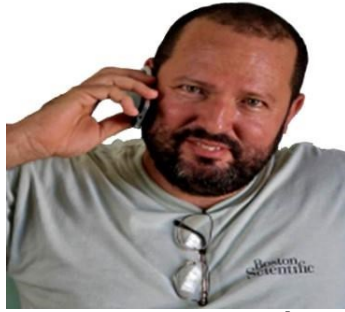
Por: Bernardo R. Arévalo