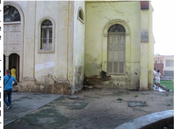
Iglesia Católica en el municipio Colón

emitido criterios al respecto. La situación ha conllevado al padre a tomar imágenes y videos para ser presentado a instituciones superiores con el fin de solucionar el problema. En las homilias dominicales el prelado siempre hace alusión al tema públicamente. Algunos fieles se sienten descontentos con la situación. ¿Sí desea preguntarle a ellos? Cualquiera puede dar testimonio sobre el asunto".