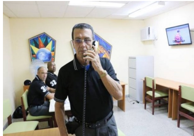
Sala de monitoreo