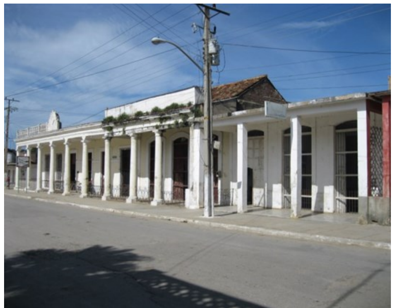
Tribunal del municipio Colón

Las personas consultadas califican de insuficiente los ejemplares que oferta la gaceta oficial sobre el tema. Entre tanto, el número de interesados aumenta. La población demanda la venta de impresos que no solo parlamenten estos plebiscitos, sino los fundamenten. Es menester, según varias declaraciones, una mayor difusión en los medios informativos oficiales.