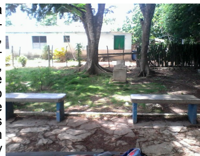
Parque sin nombre

La imagen escultórica representativa a la figura del Héroe Nacional hace 5 años fue retirada para proceder con su reparación. Hasta la fecha no ha sido regresada a su pedestal. Con la prolongada ausencia del busto la función del podio ha sido transgredida. La indisciplina social a la orden del día ha convertido la plataforma en banco y al sitio en amarradero de caballos. Sin dejar de mencionar sus aceras destruidas y su césped maltratado.