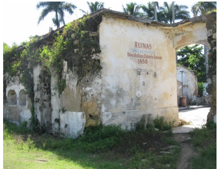
Ruinas en el hoy central azucarero México

Es necesario que el viento no cargue con la oportunidad de tener un museo local. Destellos de cómo vivió la gente que nos dio la cubanía al alcance de cada niño de pueblo. Su antiguo esplendor, los movimientos cotidianos de aquella época utilizando el mismo pedazo de tierra que hoy compartimos. Contarle a los muchachos que encima de esas montañas de escombros y adoquines dormidos descansó el emporio azucarero de Don Julián Zulueta, posteriormente gobernador de La Habana; quien acopio gran fortuna en la Cuba del siglo XIX por sus negocios de tráfico de esclavos.