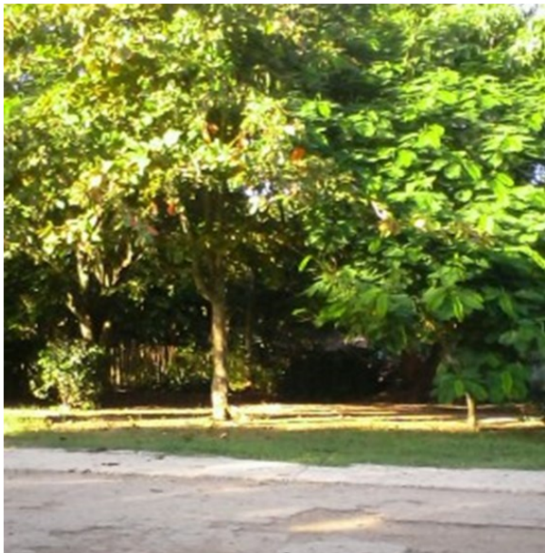
Lugar donde se suponía el parque

Los Arabos, Matanzas. Interrumpen obras de construcción de un parque, hecho que ha provocado malestar en los residentes del poblado Macagua. Los trabajos quedaron paralizados ante la falta de presupuesto para finalizar las labores de construcción. El descuido de la instalación semiconstruida propició el robo de los bancos y del alumbrado público. Indisciplinas sociales que dieron al traste con la terminación del centro recreativo.