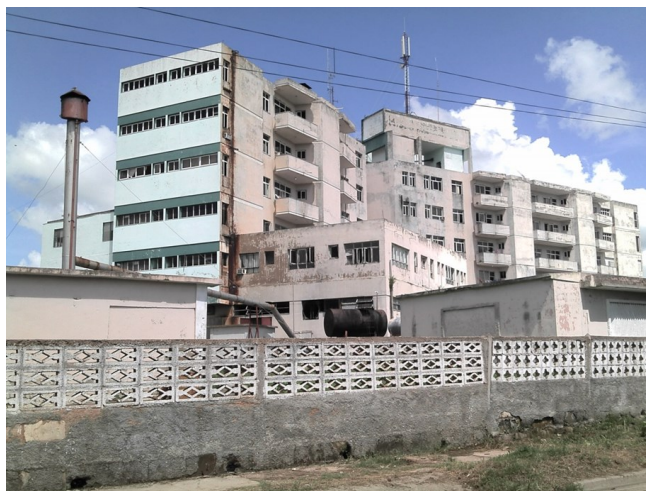
Hospital General Docente Mario Muñoz Monroy

ra sospechosa. Lo paradójico del asunto es que la directiva y el departamento de mantenimiento del centro no han hecho alusión sobre la cuestión en reuniones sindicales y matutinos. El centro asistencial, distintivo en la región, se encuentra ubicado en la