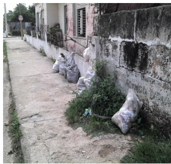
Basura sin recoger

ciudad se halla llena de porquería. En esta calle donde residio hace más de 15 días que no recogen la basura. Lo que me impresiona es que en la céntrica Calle Martí si la recogieron. Vecinos de esta calle han dado las quejas en el gobierno y en la dirección de servicios comunales en Colón".