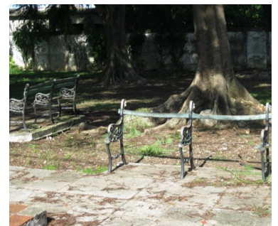
Parque colonial deteriorado