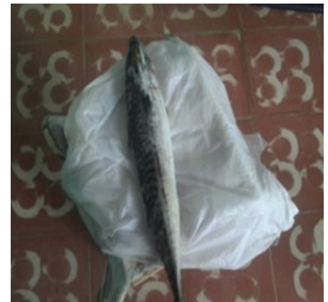
Macarela después de 15 años

También, la prioridad del suministro al turismo figura dentro del sector. Además, de acuerdo a estudios de expertos en la materia, prevalece la improductividad en las empresas pesqueras estatales.