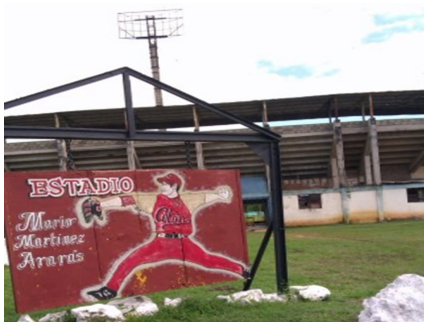
Estadio Mario Martínez Ararás

En cuanto al estado del estadio un funcionario del INDER (Instituto Nacional de Deporte y Recreación) señaló: "La institución no cuenta con los fondos necesarios para acometer las obras de reparación".