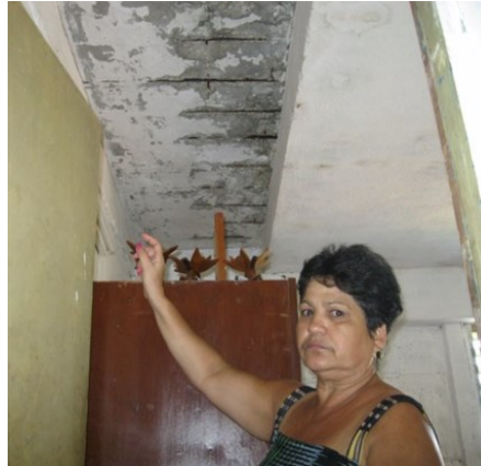
Techo en mal estado

A lo anterior, hay que añadirle las limitaciones para adquirir materiales de construcción y sus altos precios en los puntos comerciales. Estos, en equivalente balanza de pago que los encontrados en el mercado negro. Otro tema, es la interrupción de los trabajos de construcción y reparación a causa de la exigua disponibilidad financiera, en relación al presupuesto destinado para la aprobación de subsidios a la población.