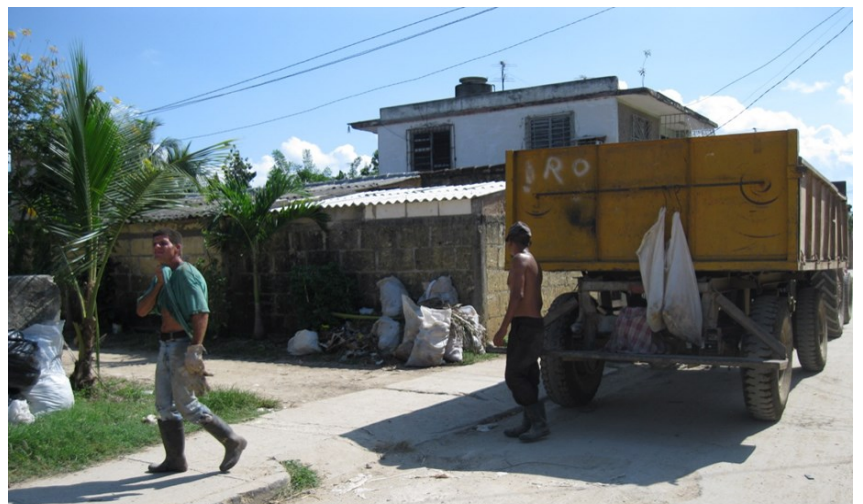
Equipo de tracción funcionando gracia a la reparación de los trabajadores

En cuanto al tema del estipendio la mayoría de los asalariados califica el sueldo devengado de ínfimo, teniendo en cuenta la nocturnidad y los altos porcentajes de riesgo sanitario. Los salarios más elevados no exceden los 600 pesos MN (Moneda Nacional) en el mes, en un sector de alto riesgo.