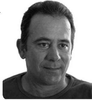
Por: Alberto Corzo Periodista ciudadano

En el municipio Los Arabos se ha hecho emblemática y crónica la impureza del río "Los chinos". Antiguo museo natural de la zona, cargado de cuantiosas leyendas sobre la comunidad de origen asiática, que un tiempo atrás vivió en este lugar y tenía al arroyo arabense como el centro de su actividad económica. Se acabaron los chinos y el río se llenó de mierda. Hoy, no sólo parte del pueblo vierte los desechos humanos en sus aguas, sino que hasta la