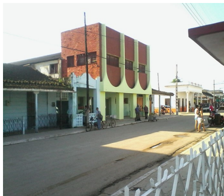
Cine Yumurí, pintado para recibir la visita

localidad y en el establecimiento comercial conocido como La Vaquita fueron pintadas sus fachadas, a raíz del evento. Las calles amanecieron limpias, las esquinas vertederos perdieron su olor nauseabundo y desaparecieron un grupo considerable de alcohólicos y menesterosos que mero-dean por las área adyacentes al parque Camilo Cienfuegos.