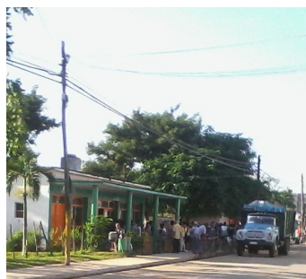
Camión recién llegado

La entidad El Deleite, donde se produjo la indisciplina