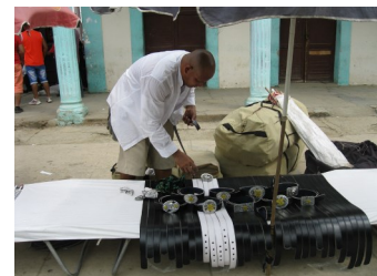
Cuentapropista en ejercicio

Un grupo considerable de contribuyentes perjudicados por el pago excesivo de impuestos, reitera que el estado no los tiene en cuenta como fuerza productiva activa. Tampoco, tiene presente las constantes carencias de materia prima y el costo de los insumos necesarios para la realización de sus actividades; por ende, las ganancias que ellos perciben no se comportan de