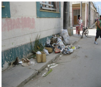
Basura en la calle

No obstante, a los incumplimientos estatales en los trabajos de higiene en la vía pública, la indisciplina social es factor de orden primario en este asunto.