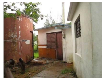
Taller cerrado, en Tinguaro

militar y como es plantilla de la empresa tenemos que respetar su lugar. La otra alternativa es hacer una contrata a otra persona que este calificado como electricista; o que el jurídico de la