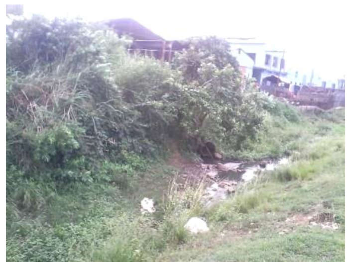
Tubo que vierte desechos de la fábrica, al fondo, al río Los Chinos

persona pisando suelo cubano, se exija a las autoridades locales por la preservación del medio ambiente. Pues, la falta de alimentos y la vida miserable que llevamos no podemos cargársela a la tierra que nos vio nacer. Duele y duele hondo, ver como cada vez más nuestras vidas están siendo sitiadas por los excrementos. Duele el campo y duele la ciudad que tenemos en medio del pecho, quizás alguien tome conciencia de esto. Al final, nuestros hijos y nietos nunca nos perdonarán la falta de voluntad.