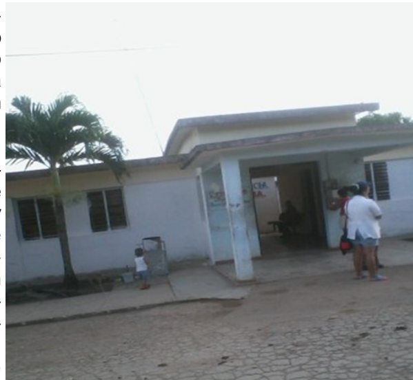
Policlínico en el poblado San Pedro de Mayabón

Según fuentes oficiales, la aparición de personas contagiadas en el territorio está vinculado con residentes del poblado que trabajan en la ciudad