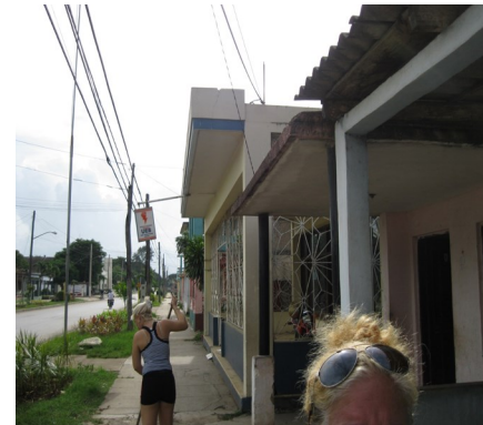
Al fondo, local de la empresa eléctrica