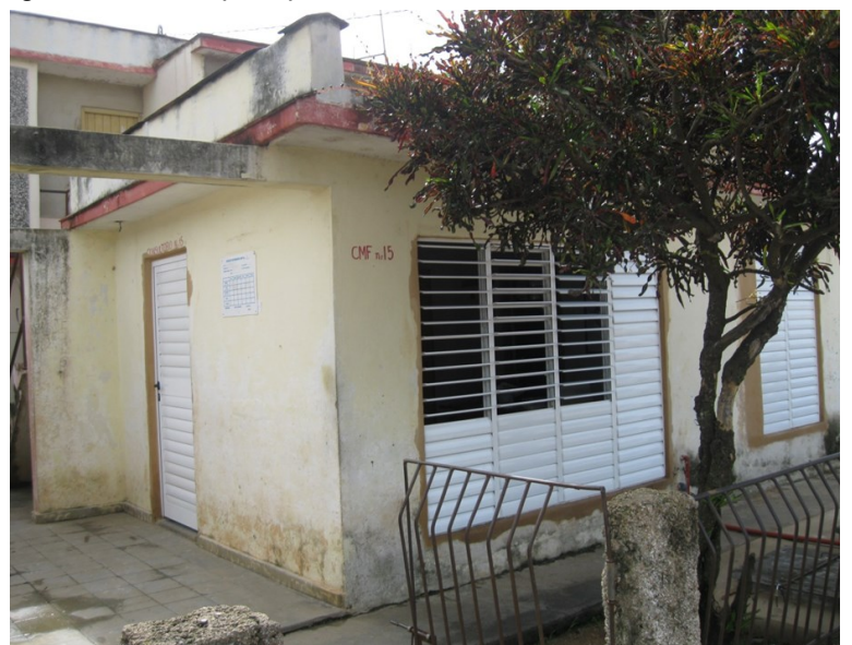
Centro asistencial del área infestada