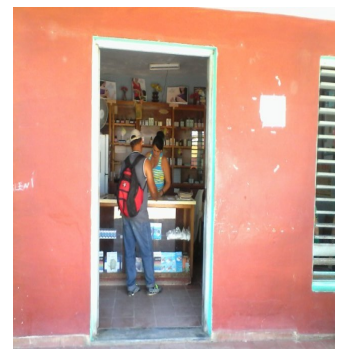
Farmacia, poblado Macagua