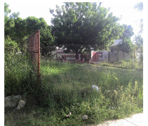
Círculo infantil Hermanitos Chilenos

Pienso, que a los periodistas sean oficiales o no, no se les puede negar información. Es una realidad que las áreas del círculo están descuidadas y abundan los perros sarnosos dentro del local donde están los niños".