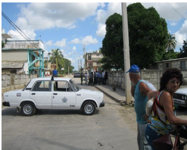
Carro patrullero cierra la calle donde ocurrió el asesinato

Fuentes que conocen al comisario del delito confirman que acostumbraba a deambular por la zona, borracho y a altas horas de la noche.