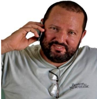
Por: Bernardo R. Arévalo Periodista ciudadano

Como la situación anterior ocurren infinidad de ellas en nuestro país. Y esa peculiar característica de conformidad se revierte en la capacidad de permanencia de los que mal nos gobiernan. A mi modo de ver las cosas, por los años, la lana que llevamos encima está muy pesada. Los pasos son lentos y vamos encorvados, sin ánimo de hacer ni decir nada; con la iniciativa colgada a mitad de cintura. Los años pasan y ya no hay argumentos para resistir la posición de cuatro patas, espejo de nuestro querido rumiante, con la frente mutilada en cabeza ajena y complacidos de la realidad que nos tocó vivir.