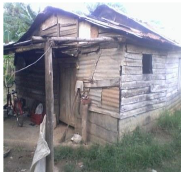
Vivienda temporal de Bizmara

mara, puntualizó: "A mí me dijeron que demoliera mi casa que nada más que entrara dinero me lo iban a dar para empezar la construcción de la nueva vivienda. Actualmente, estoy viviendo con mis hijas menores en un cuarto que está en muy malas condiciones. Cuando llueve se moja completo. Tengo que cocinar con leña en el patio porque no tengo equipos de cocción; cosa que también me prometieron y aún no me han dado. Conmigo, una vez cometieron una injusticia y ustedes me ayudaron a resolver el problema. Ni a la delegada del poder popular en la zona ni a nadie más le interesa. Tengo fe en su trabajo, por eso nuevamente me dirijo a ustedes. La gente confía en ustedes".