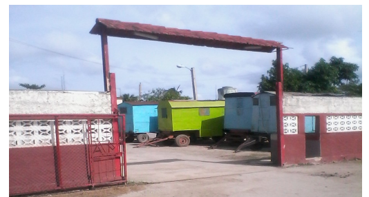
Discoteca de Los Arabos