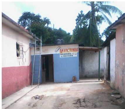
Panadería La Victoria

que se enfría, tiende a reducir su tamaño. También, si no tiene el aceite requerido se desmorona". Entre tanto, se incrementan los testimonios adversos respecto a la visita de José Ramón Machado Ventura, al municipio. En esa ocasión mejoró la calidad del producto. Otra interrogante para la gente: por qué después de acontecer el acto masivo de rechazo al pan, el alimento mejoró sólo 3 días, para luego volver a su pésimo estado habitual.