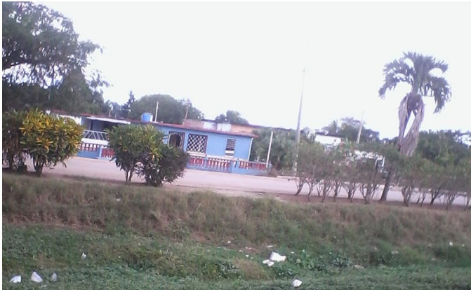
Espacio vacío entre los arbustos, al fondo la estación de policía

tudentes en manos, asistidos por un auxiliar de la policía, visiblemente coléricos, la emprendieron a golpes con el banco propiedad de la comunidad; hasta dejarlo destruido y a nivel del piso, como si nunca hubiera existido.