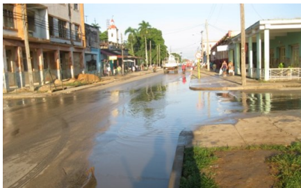
Intercepción Máximo Gómez y Maceo

Al no contar las calles con un eficiente sistema de desagüe que permita evacuar las aguas como resultado de las precipitaciones en el territorio, cuando llueve se hace difícil trasladarse dentro del períme-