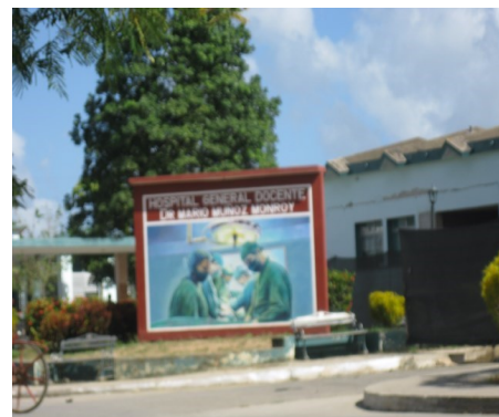
Hospital Mario Muñoz Monroy

En sentido general, si bien se observan en el hospital tareas de remodelación y ampliación del perímetro consignado al cuerpo de guardia y a otros espacios dentro del centro, de manera incompatible contrasta con la falta de especialistas, las deficiencias en el laboratorio clínico, la frecuente escasez de reactivo y papel para encefalograma; así como la insuficiencia de porta sueros en la salas de ingresos y las deprimentes condiciones higiénicas sanitarias que muestra dicha institución hospitalaria.