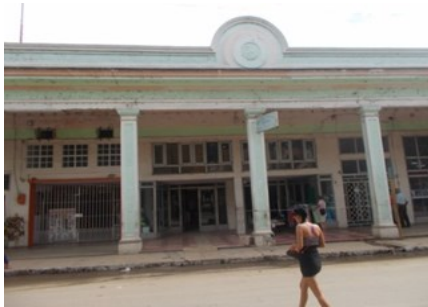
Tienda La Canastilla

Yailen Capote, joven de 15 años de edad, quien dio a luz el día 2 de noviembre, comentó: "Las cunas solo son para casos sociales y el colchón me lo darán cuando tenga 5 o 7 meses de parida. Mi esposo no tiene trabajo todavía porque es muy joven y su familia es pobre al igual que la mía. Quieren que las mujeres paran pero no dan ningún tipo de ayuda para que criemos a nuestros hijos".