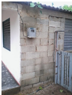
Contador de Confesora

te en la Calle Caridad # 7, entre Isabel Segunda y Callejón Real, hace un año estuvo involucrada en una situación similar. En aquella ocasión el cupo fue 462 pesos MN. Importe que se negó a pagar por no contar con recursos para ello; solicitando la presencia de los inspectores de la compañía eléctrica en su domicilio para verificar el contador eléctrico. Donde, como conclusión del dictamen técnico, en aquel momento, se señaló como causa una interpretación incorrecta de la lectura.