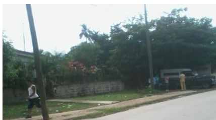
Amarillo llenando un carro particular

Los inspectores llamados por la población amarillos surgieron a raíz de la crisis económica de la década de los noventa, catalogada como periodo especial por el gobierno cubano.