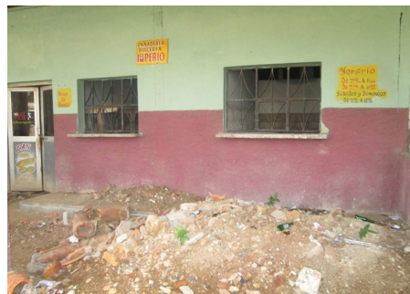
Panadería El Imperio

y Calixto García. El panorama que exhibe el local muestra que la terminación todavía demora. Este martes 1 de diciembre, las puertas permanecían cerradas y sin acciones constructivas, donde en su interior y exterior hay montañas de escombros.