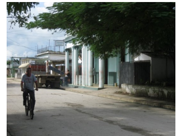
Funeraria de Los Arabos

"Es una falta de respeto que no tengan las cajas para que uno pueda sacar a sus difuntos. No es fácil exhumar a un ser querido.