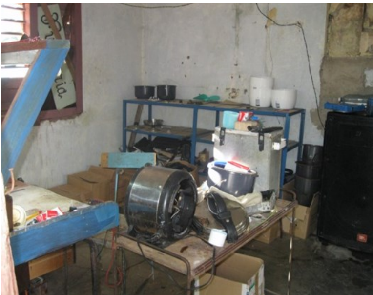
Taller de reparaciones del batey Tinguaro, abierto