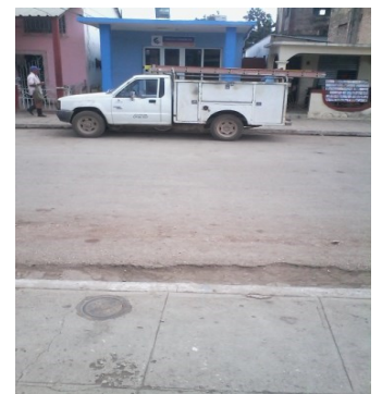
Oficina en Los Arabos

Este viernes 4 de marzo se contactó, vía telefónica, con Mayra Hernández, funcionaria que atiende el área de atención a la población en ETECSA (Empresa de Telecomunicaciones de Cuba SA), quien puntualizó: "Los servicios de mensaje multimedia se encuentran congestionados y no sabemos por qué. Tampoco sabemos por qué los correos nautas instalados en los móviles están consumiendo más de lo debido. Nuestra empresa trabaja para suplir cualquier tipo de deficiencia".