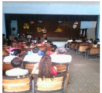
Casa de cultura

sos MN (Moneda Nacional), sin exonerar a los adolescentes que también asisten al local. El sábado 20 de febrero el anuncio dejó perplejos a los clientes asiduos, quienes esperan una respuesta consecuente a su favor por parte de Cultura Municipal. Teniendo en cuenta el antiguo precio (30 $), el valor para entrar al área ascenderá a 20 pesos más.