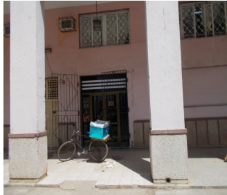
Ferretería La Exclusiva

medios. Llave, llave doble, latiguillo y codos cuestan: 10.00, 13.75, 3.35 y 2.50 CUC (Moneda Libremente Convertible), respectivamente. Acentúa el dilema la ausencia de pegamento para sellar las obras, en los puntos minoristas.