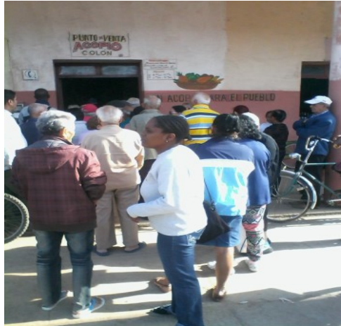
Cola para comprar papas

Para los pobladores no es entendible la escasa comercialización de la vian-