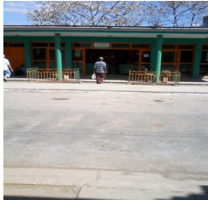
Mercado El Deleite