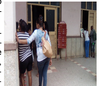
Heladería en Colón