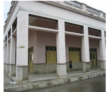
Heladería del municipio Colón