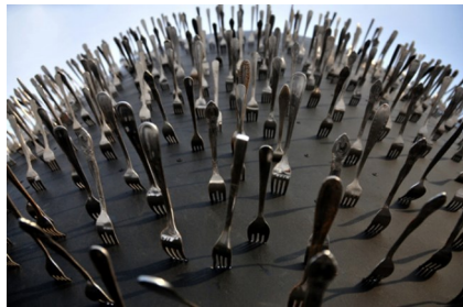
'Delicatessen', obra de Roberto Fabelo

Las muestras colectivas o personales, principales (oficiales) o colaterales ofrecen una fascinante ceremonia de simulacro y homologación con productos del mundo