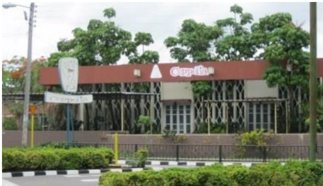
Coppelia de la capital provincial

El complejo lácteo del municipio Cárdenas es el princi-