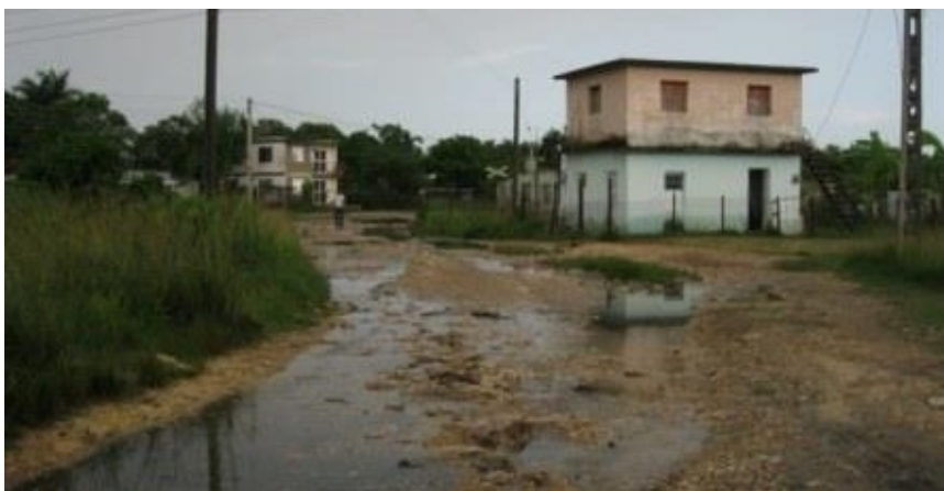
Calle afectada del Consejo Popular Sergio Gonzales (Tinguaro)