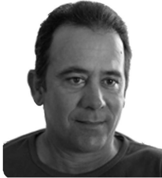
Por: Alberto Corzo Periodista ciudadano

Ningún ecosistema escapa a la catástrofe. Cada año, del área boscosa local, nombrada en Los Arabos como "La Forestal", son apresadas cientos de aves, sin que las autoridades logren acabar con las capturas y el rentable negocio. Pájaros exóticos como el azulejo, el verdón, el mayito, el cacatillo y el gorrión sufren persecución despiadada. Las especies endémicas y en extinción no escapan al peligro. Es impensable que nuestros hijos conozcan al tocororo, el cartacuba, el catey, la jutia conga y el maja Santa María sólo en las ilustraciones de los