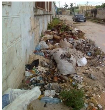
Calle línea #266, entre Santa Rita y 233