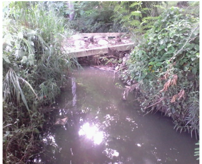
Río de los Chinos contaminado

Frente a los progresivos desmanes al medio ambiente, las leyes para su protección parecen pura fanfarroneada de las autoridades; una madeja de términos técnicos proclive a la mutación animal. Para nadie es un secreto que la pérdida de la biodiversidad compromete el futuro. Simplemente, se vende barato el bienestar de nuestros hijos, sin tratar a fondo lo irracional del problema.