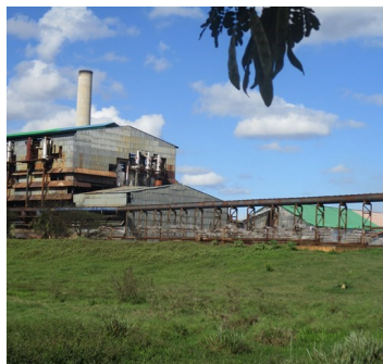
Industria azucarera.

Según las indagatorias preliminares de la prensa