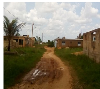
Caserío Diana.