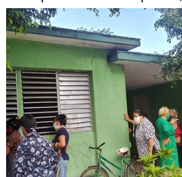
Farmacia piloto.

agudización de carencias. Tampoco llegó Captopril, el fármaco más consumido por la población de pacientes hipertensos. La Dipirona,