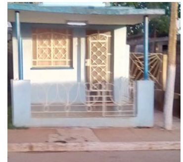
Casa allanada.