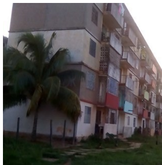
Edificio # 3.

Lázaro, quien reside en el apartamento 6, ubicado en el tercer piso, estuvo asinto-