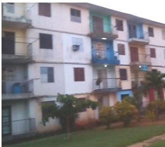
Edificio # 1.

Como resultado del contagio de Rojas el edificio # 1 de dicho consejo popular fue aislado. Las personas no fueron trasladadas a centros de aislamiento. Se mantienen en sus hogares con pesquisajes diarios. La medida responde al proceder epidemiológico que corresponde a estos casos.