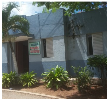
Escuela cerrada.

Dos de los centros de aislamientos estaban ubicados en la cabecera municipal. El primero estaba situado en la conocida por escuela especial Paquito Gonzáles, sito en la calle B; el segundo, en el motel del pueblo, aledaño a la carretera central. Una tercera instalación se encontraba en el punto conocido como puesto de mando de la empresa Gusev, en el poblado San Pedro de Mayabón.