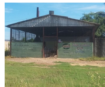
Punto de venta.

Ese martes la desesperación se apoderó del punto