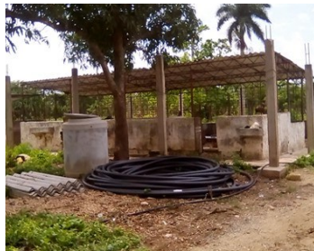
Corral violentado.

Mientras aparece otro medio de transporte Nuevo Oriente permanece aislado de la cabecera municipal, la ciudad Colón.