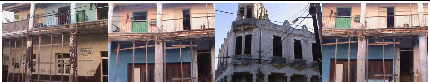
Imágenes de zonas urbanas en derrumbe en la ciudad de Pinar del Río.

NO LO GUARDES, ENTREGALO A TUS VECINOS Y AMIGOS.