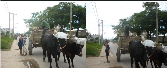
Imágenes de medios utilizados para recoger basura

Llamamos a que deben adoptarse por parte de la administración de Comunales del municipio todas las medidas pertinentes y necesarias para que los equipos y medios de trabajo de estos trabajadores sean adecuados a la actividad que realizan, de modo que garanticen la Seguridad y la Salud de sus empleados.