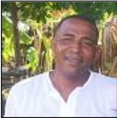
Por: Rafael Hernández Blanco

En el sector de los Servicios Comunales son importantes las condiciones de seguridad e higiene del trabajo, que se debe aplicar en todo los centros de producción y servicio del territorio del municipio de Guane, para un buen desempeño del trabajo y en la protección del individuo.