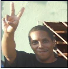
Por: Yasser Reinoso Ramos

La grave situación de alimentación por las que atraviesan los presos cubanos, no es reconocida por el gobierno y miente sinicamente a la opinión pública nacional e internacional, mientras miles de reos en la cárceles cubanas se mantienen bajos de peso y desnutridos.