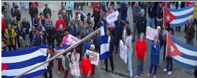
Imágenes de mitin de repudio contra defensores de los Derechos Humanos.