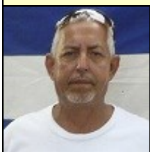
Por: Raúl Luis Risco Pérez

El pasado 1ro de mayo, para nuestro país, lejos de ser un día de fiesta y celebración para los trabajadores, se convirtió en un día de bochorno y vergüenza nacional.