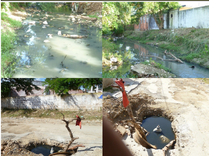
Imágenes del Arroyo Galeano y tuberías de agua potable contaminada.

Por otra parte los vecinos de este reparto que viven a ambos lados de los márgenes del ya mencionado arroyo, el cual es utilizado para verter las aguas negras de esta parte de la ciudad, se han quejado por el mal olor reinante, así como han pedido al gobierno se separe la tubería de agua potable de la tubería de aguas albañales, ya que ambas presentan filtraciones y roturas, trayendo como consecuencia la contaminación del agua potable.