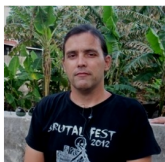
Edición Camilo E. Olivera Peidro