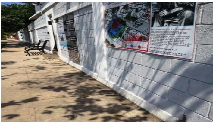
Mural de la Residencia del Pintor KCHO.

"Esta es una gran oportunidad. Yo vengo aquí casi todos los días desde Centro Habana, para buscar información. Internet gratis, hay que aprovecharla, no la vas a encontrar en otro lugar de Cuba. En su biblioteca he encontrado libros muy buenos para mi tesis de economía. Muchos vienen en grupo y se pasan horas aquí para lo del Wifi, esa está abierta todo el día, yo no tengo un teléfono inteligente pero me conecto en las computadoras", comentó un joven universitario que asiste frecuentemente al lugar.