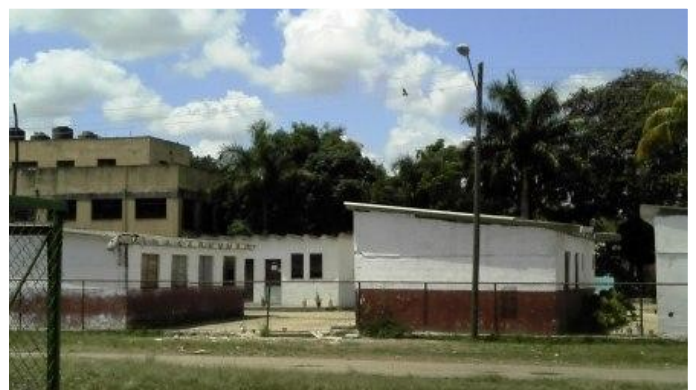
Escuela Primaria: Sierra Maestra.