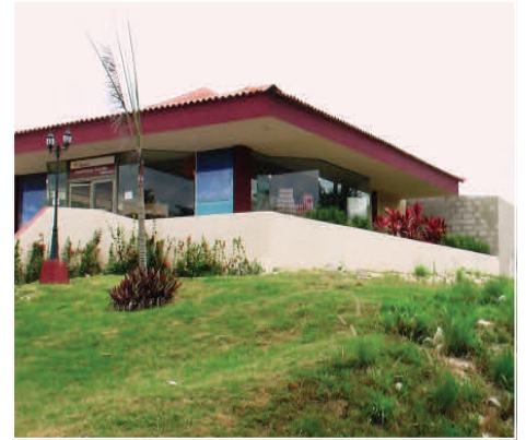
Foto: tienda Caracol, lugar donde la corporación S.A Caracol expropió el terreno.