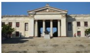
Por: JBRD Cubano de a pie.

Todos señalaron, de común acuerdo, el que está ubicado en Prado y Brasil, exactamente frente al Capitolio. Quien le observe (ver imagen), podrá ver que parece un rompecabezas deteriorado, solo sostenido por las maderas que fueron puestas para evitar el derrumbe.