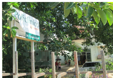
Policlínico de Calabazar.

Al Policlínico Mártires de Calabazar, siguen llegando pacientes víctimas de este virus. En una semana llegaron 12 casos. Estos, fueron remitidos para los Hospitales Julito Díaz y Enrique Cabrera, este último conocido como el Hospital Nacional. Tres de ellos fueron reportados como fallecidos.