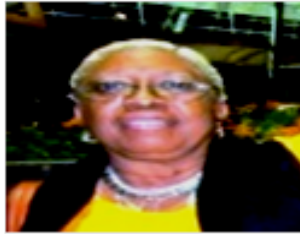
Por: Susana T Mas Iglesias. Periodista Ciudadano.

competentes de salud y medio ambiente en Cuba.