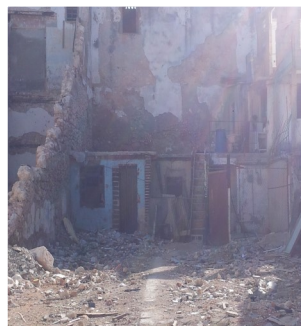
Derrumbe de Factoría

La misma adición: " Yo decidí volver a vivir en el derrumbe de lo que fue mi casa. Allá hay que cargar el agua y la corrupción está por los cielos. Los muchachos fuman marihuana y las muchachas se prostituyen. Fui al gobierno a reclamar por los supuestos apartamentos. Me dijeron que tenía que esperar por que habían personas que llevaban más tiempo que yo en albergue. Sin embargo, se de quienes pagaron su dinerito a los funcionarios, y ya tienen el apartamento."