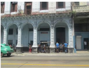
Escuela Primaria Manuel Ascunce

Padres de varios estudiantes de la capital, se sienten molestos por las exigencias de las instituciones educativas. El reglamento para el uso del uniforme ha traído comentarios y críticas hacia gobierno debido a los requerimientos que se imponen. Uno de estos, son las llamadas felpas de cabello, que tienen que ser de color Rojas, blancas o negras. Los zapatos se exigen de color negro, las medias blancas y largas. Estos elementos se encuentran a un alto precio en tiendas recaudadoras de divisas (TRD) y no todos pueden adquirirlos.