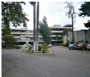
Entrada del Hospital Fran País

el ministro y el gobierno. El almacén de piezas de mantenimiento, no tienen tazas de baño, llaves para los lavamanos y azulejos. Por esta razón los baños están en malas condiciones. Uno de los elevadores del edificio central lleva más de dos meses sin uso.