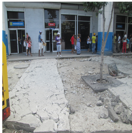
Acera del mini mercado La Isla de Cuba

En un tramo de la concurrida Calle Monte, se encuentra situado el mini-mercado La Isla de Cuba, tienda recau-