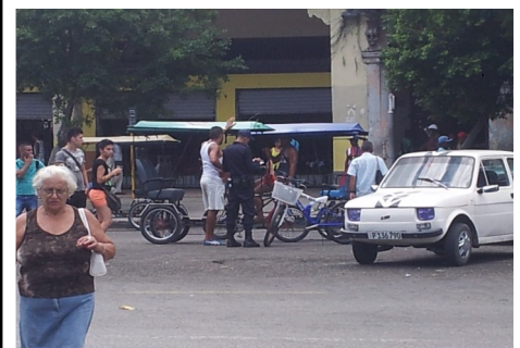
Operativo policial a Bici-taxeros

"Yo no tengo la culpa. Nos forman por las mañanas en el matutino y nos dicen lo que tenemos que hacer.