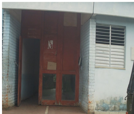
Supermercado conocido como (Minimax Redondo)

"A mi niño le asignan picadillo de res, 1 libra, pues no recibe pollo. Desde que debían haberlo despachado estamos a 11 de septiembre y aun nada. Siempre hay dificultades, los carniceros dicen que no es culpa de ellos, que el problema es donde se distribuyen. A quien le creo, todo el tiempo es lo mismo, no hay responsabilidades ni responsables. Una vecina me comentó que en