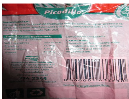
Bolsa de Picadillo sin Fecha de Producción

cen apagones, aunque éstos sean por escaso tiempo, pero sí en reiteradas ocasiones, los alimentos que se encuentran congelados conllevan a un deterioro en su calidad, lo que puede ocasionar trastornos digestivos que llegan a producir intoxicaciones, vómitos o descomposiciones estomacales.