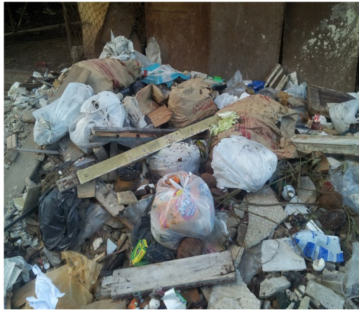
Vertedero de calle Florida y Esperanza

La Empresa de Servicios comunales del área, presenta problemas en la recogida de los desechos. La suciedad visible de toda la comunidad se hace presente. El vehículo destinado, en ocasiones, demora hasta 10 días sin realizar su recorrido. Los lugares, han presentado sus quejas en dicha entidad sin tener un resultado positivo.