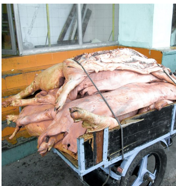
Carne de cerdo en el momento de ser retirada del establecimiento

Según comentan algunos lugareños, esto no es primera vez que ocurre. En otras ocasiones han tenido que retirar, por mal olor y su textura putrefacta, otros alimentos. A pesar del alto consumo existente, que demanda este producto en específico, el alto precio del mismo, no permite una adecuada venta. Teniendo como consecuencia la pérdida total de este.