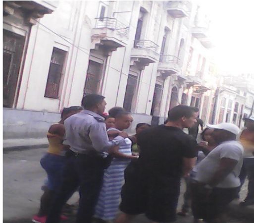
Imagen tomada en el momento de la investigación.

Este hecho ocurrió el pasado jueves 19 del mes en curso, alrededor de las 06:00 de la mañana, en Calle Águila, entre Calle Corrales y Gloria, en la localidad de Jesús María. En el lugar se personaron dos policías con números de chapas 04785 y 11130 en sus uniformes. Los mismos, se presentaron para investigar el hecho. El sujeto que realizó los disparos era un agente del orden público (Policía).