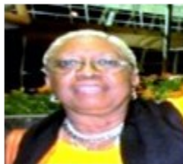
Por: Susana T. Mas Iglesias Periodista Ciudadano

cen apagones, aunque éstos sean por escaso tiempo, pero sí en reiteradas ocasiones, los alimentos que se encuentran congelados conllevan a un deterioro en su calidad, lo que puede ocasionar trastornos digestivos que llegan a producir intoxicaciones, vómitos o descomposiciones estomacales.