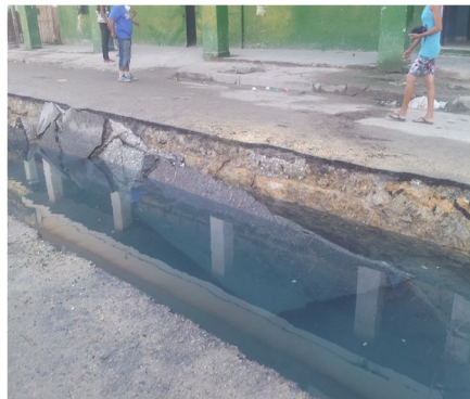
Uno de los tramos colapsado de Calle Vives

Habana Vieja, La Habana (ICLEP). Descontento en la población provoca quejas por obra inconclusa en el barrio Jesús María. Varios vecinos, en un principio, mostraron conformidad. Al percatarse que la obra quedaba incompleta, comenzaron las reclamaciones evitando posibles accidentes.