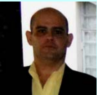
Por: Frank E. Carranza López

T atiana, madre soltera del poblado de Aguacate en la provincia Mayabeque, decidió introducirse de forma ilegal en el local que otrora fuese la carnicería del pueblo. El local está cerrado por inminente peligro de derrumbe. Está ubicado en la avenida 22 # 3527 / 35 y 37. Fue la única opción, para esta mujer desesperada y con dos hijos. -Mi esposo murió en el mar, es verdad, pero murió Libre- nos dijo Tatiana, aun con la voz entre cortada.