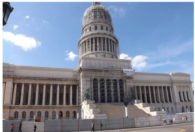
Exterior en restauración del Capitolio de la Habana

“La restauración de la fachada externa está casi concluida, pero las labores generales están todavía a un 60 por ciento para su culminación”, declaró un restaurador que se encuentra inmerso en la obra, este declaró en condición de anonimato.