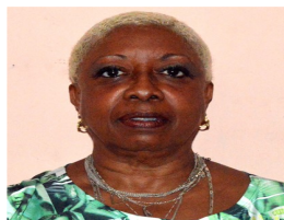
Por: Susana T Mas Iglesia Periodista Ciudadano

locutores pasaban puntualmente a solicitar los distintos servicios que allí se ofertaban.