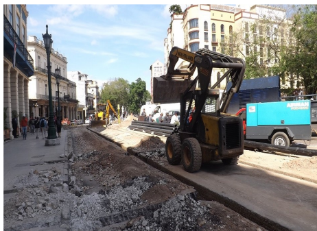
Equipos en las labores constructivas

Hace menos de dos semanas comenzaron los trabajos para proveer de agua potable a los hoteles Inglaterra y Telégrafo, la Pastelería Francesa y el Teatro Nacional Alicia Alonso. Estos centros de afluencia de turistas obtenían el agua potable a través de camiones cisternas en días alternos. Las viviendas ubicadas en una ciudadela entre el hotel Inglaterra y El Telégrafo, serán favorecidas.