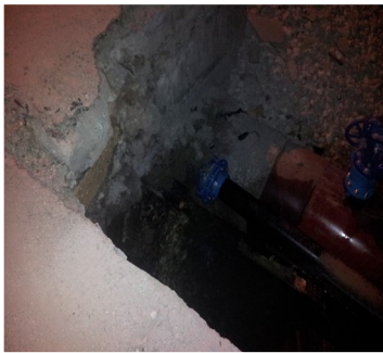
Imagen de la conductora de agua desconectada

Los vecinos de la localidad se han quejado en varias instancias gubernamentales por la falta de agua y por la situación de las roturas en las calles, pero no han recibido respuestas o alguna solución al respecto. Muchas de las cisternas de zonas bajas están en estos momentos contaminadas por el vertimiento de aguas albañales.