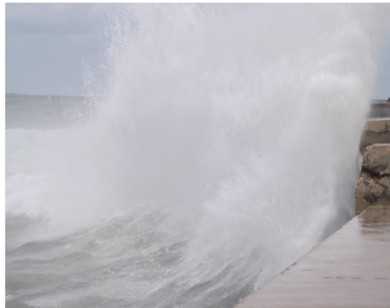
Olas azotando el malecón habanero

Las lluvias que azotaron la capital en los últimos días produjeron fuertes marejadas en el litoral norte habanero con penetraciones del mar. El hecho no ocasionó pérdidas de vidas o materiales severas, aunque tuvieron que ser evacuadas varias familias que viven en garajes y sótanos, que fueron inundados. La avenida de malecón sufrió daños, capas de afacto y hormigón