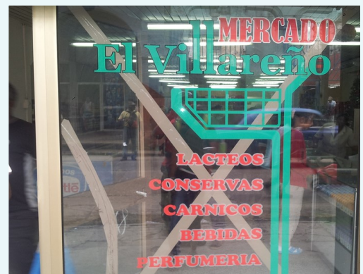
Imágenes del mercado El Villareño

“Nadie te explica por qué la tienda no tiene un horario establecido para abrir, pero a la hora de cerrar sí que son muy puntuales”, expresó una consumidora de este centro.