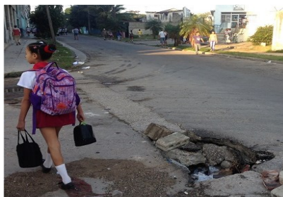
Estudiante transitando cerca del hueco