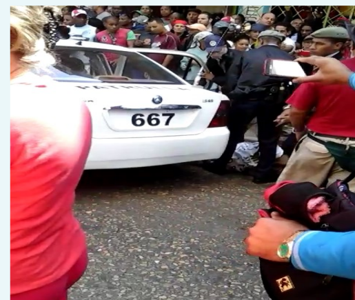
Momentos del arresto de las mujeres, que fueron lanzadas al piso