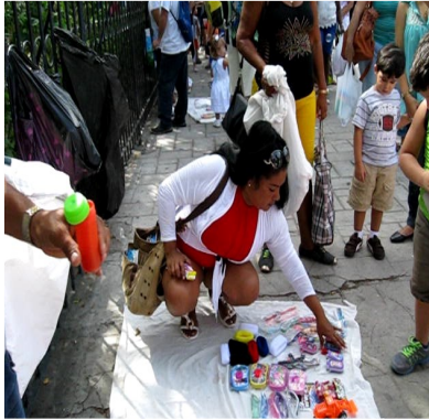
Imágenes de una trabajadora del sector en las afueras del parque

Habana Vieja, La Habana (ICLEP). En el Parque infantil La Maestranza, desde hace algún tiempo han estado tratando de desalojar a los trabajadores del sector privado que venden juguetes para niños. La medida implantada por el Gobierno Municipal ha perjudicado a infantes y trabajadores.