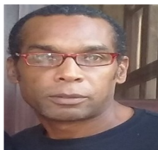
Por: Sergio Girat Estrada Periodista Ciudadano

en el año 2012, para la localidad de Cuquine (antigua finca del ex presidente Fulgencio Batista) en las afueras de la ciudad. Los habitantes se negaron a abandonar sus viviendas porque alegan que estas comunidades, no tienen óptimas condiciones para vivir.