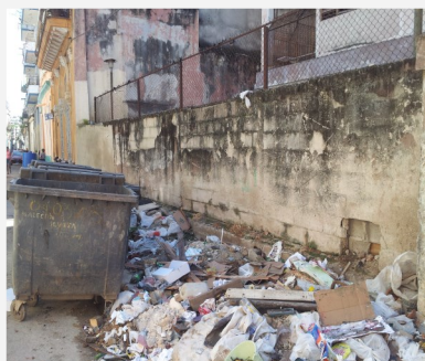
Lateral del círculo infantil Alegre Cubanito

La Empresa de Comunales de la localidad puso tanque de basuras que no recoge como debiera diariamente.