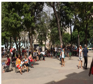
Imágenes de uno de los puntos de Wifi

Rebajas clandestinas en el precio para la navegación en Internet, se ha estado llevando a cabo por individuos, al margen de la estatal Empresa de Telecomunicaciones (ETECSA). Las recargas ilegales para las cuentas nautas se realizan desde un programa específico que únicamente posee esta empresa.