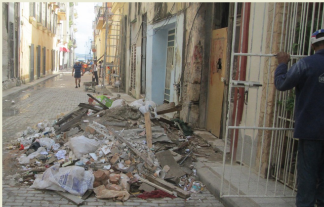
Imagen de acumulación de escombros

Vecinos se han quejado a varias instancias gubernamentales por los escombros que se acumulan cada vez más en plena calle y que impide que personas y vehículos puedan transitar. La basura se acumuló luego que se les pidiera a los vecinos que sacaran los escombros. Entidades como la Empresa de Comunes no le han dado solución al problema.