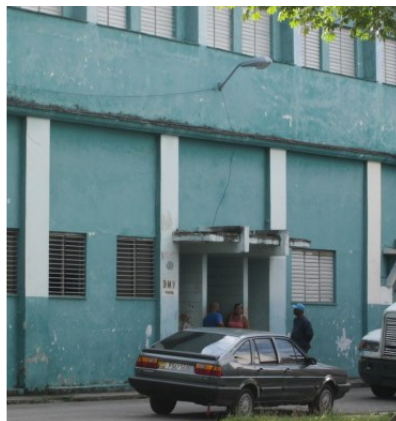
Entrada de la dirección municipal de vivienda Cerro