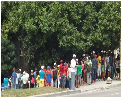
Imagen del sepelio de la víctima

Otros comentaron que la policía habían detenido a los asesinos, y que esto es debió a un ajuste de cuenta. No sé a podido confirmar esta última información.