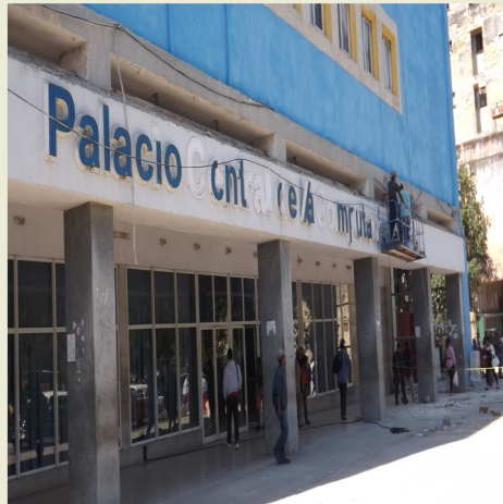
Parte exterior del inmueble que presta el servicio

"El palacio está destinado para un público general, aunque mayormente los usuarios acuden a conectarse a Internet. Hemos pedido reiteradamente a Etecsa que amplíen el servicio de internet pero no se ha logrado", declaró una funcionaria del Joven Club bajo estricto anonimato.