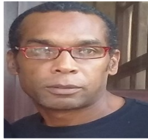
Por: Sergio Girat Estrada Periodista Ciudadano

"No estudio tanto para estar escuchando protestas de la gente sobre las fumigaciones y los basureros, realmente me siento fatigada con esto", declaró una estudiante de medicina de cuarto año que radica en la facultad de Julio Trigo. Alegó: "Mientras que continúen salideros de aguas en las calles y basureros en las esquinas no habrá como erradicar al Aedes, aseguro que esta campaña no tendrá los resultados esperados", declaró la fuente médica.