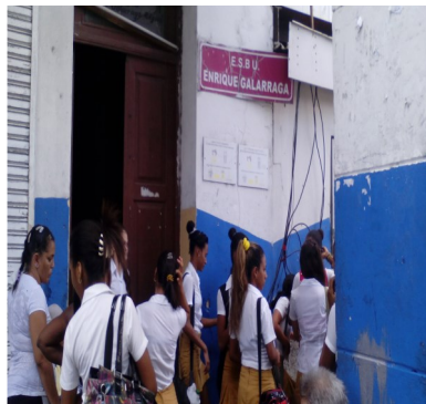
Imagen de la entrada de la escuela Enrique Galarraga.

La escuela está ubicada en la calle Máximo Gómez entre Factoría y Suarez y cuenta con una matrícula de 180 estudiantes, de los tres niveles en la enseñanza media. Los educandos no han contado durante el presente curso escolar con la plantilla total de profesores en sus aulas. Es sabido que el rigor de contenido, en varias materias impone a los alumnos una carga mayor de estudio. La metodología de profesores improvisados egresados de Universidades Técnicas, al parecer, no logra comunicar correctamente el contenido de las materias a sus estudiantes y esto podría ser la verdadera razón de los resultados.