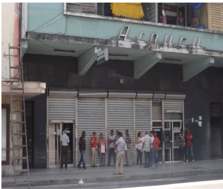
Sucursal bancaria climatizada

Mientras duró el problema en la sucursal, ubicada en Calle Infanta #255 entre calle Valle y San José, el horario de apertura como era establecido, de 8:30 am a 3:30pm, fue modificado de 8:30 a 12:30 del mediodía. El calor existente dentro del inmueble provocó la pérdida de muchos clientes, según una fuente de esta entidad. La sucursal bancaria, es una de las tres existentes en todo el municipio