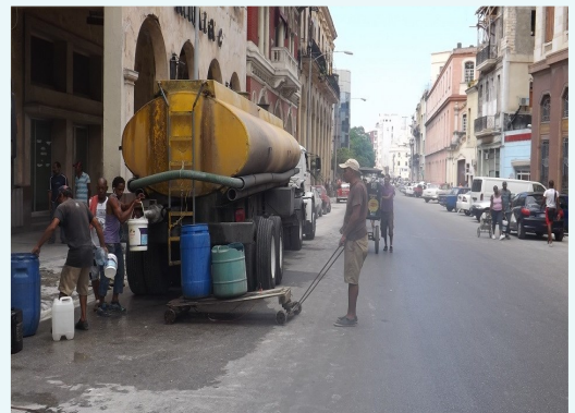
Camiones cisterna que proveen agua en la localidad

"Las reparaciones han estado lentas. Se comenzó con fuerza pero la falta de recursos han obstaculizado el avance de las obras; teníamos un presupuesto que se agotó. Estamos a la espera de que el gobierno asuma los costos", declaró un trabajador de Aguas del Sur, bajo estricto anonimato.