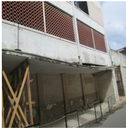
Inmueble en deterioro

El inmueble se encuentra Ubicado en la calle Compostela, entre Brasil y Muralla. La oficina del historiador de la ciudad, impulsa un