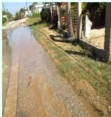
Imagen del salidero de agua