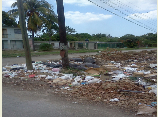
Imágenes de la acumulación de desechos frente a la porta médica