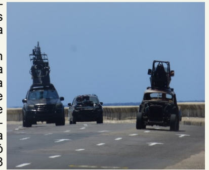
Vehículos utilizados en la filmación

El filme es dirigido por F. Gary Gray, se espera su estreno en la pantalla grande en abril del 2017, los rodajes en Cuba terminaron el día 4 del mes en curso. Esta será la primera historia de una nueva etapa de Hollywood en Cuba.