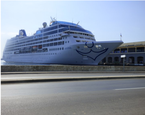
Crucero Adonia en terminal portuaria de La Habana

Habana Vieja, La Habana, (ICLEP). El Crucero Adonia, reinaugura los viajes marítimos entre E.UU y Cuba. Entre los 704 pasajeros, doce fueron cubanos americanos que pudieron abordar el buque luego de intensas presiones que hubo que realizarle a la contraparte cubana. El suceso acabó con una negativa de más de medio siglo.