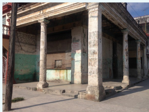
Punto de venta , unidad 1404