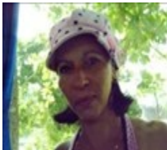
Por: Yamile Bargés Hurtado Periodista Ciudadano

en su interior había una luz inmune a la maldad y tenían que liberar al resto de sus hermanos cegados. Esta lucha no sería fácil, costaría muchas vidas, mucho sufrimiento, la serpiente verde ha entrenado a muchos esclavos para ser asesinos.