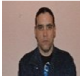
Por: Camilo Ernesto Olivera Periodista Ciudadano

El lado oculto de ese sistema, los turbios intereses y negocios que oculta, quedan fuera de la vista del cubano. O así ha sido hasta ahora. Durante décadas, Cuba ha exportado sangre y productos sanguíneos particularmente a países aliados. Estadísticas internacionales, disponibles a partir del 1995, indican que tales ventas le devengan a Cuba un promedio anual de US$30 millones. El negocio, carece del consentimiento requerido de alrededor de 400,000 ciudadanos cubanos, que anualmente donan su sangre, presionados en campañas masivas a nivel nacional.