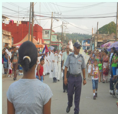
Recorrido realizado en la fiesta patronal

"En muchísimos años no recuerdo que nuestro patrón haya sido trasladado por el pueblo. Es muy bueno que las costumbres católicas se retomen, así también llegarán los buenos hábitos de antaño. La peregrinación este año resulto mucho más masiva, mientras más caminábamos más personas se unían a la marcha", relató una señora de 72 años de edad, quien se considera una ferviente católica desde los tiempos que su religión, fundada en el año 1730, era vista como contra revolucionaria.