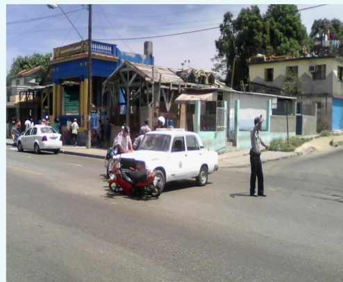
Auto policial impactado contra la motocicleta

"La patrulla se llevó la señal del Pare, sin mirar para ningún lado. Eso sucede por estar todo el tiempo detrás de los motociclistas que por aquí parquean para botear o algo así. Pero de seguro, como siempre ocurre, a ellos no les pasa nada ya que se creen que son la ley. Ellos están para defenderlas y hacerlas cumplir, no para violarlas. Ahora si uno comete alguna infracción al momento ellos te pasan la cuenta", alegó un chofer de un taxi particular que cubre esta ruta.