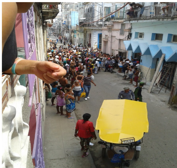
Multitud que salió en defensa de los vendedores

Este hecho ocurrió el pasado 13 de Mayo a las 3:00 pm en Calle Águila, esquina Gloria. Los trabajadores por cuenta propia se dedican a comprar el pan y la galleta en la panadería y después en sus carretillas se la venden al pueblo.