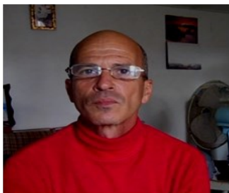
Por: Nelson Rodríguez Chaltrant Cubano de a pie

de Armas o Explosivos", y en este caso lo inculpaban por los hechos previstos en el artículo 214 del Código Penal, al habersele ocupado por los agentes de la Policía, una cuchilla de afeitar.