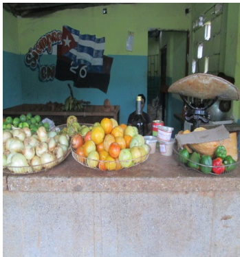
Punto de venta en su reapertura

Boyero, La Habana, (ICLEP). Vecinos del reparto Capdevila muestran alegría después que uno de los Punto de Ventas de viandas se abriera al público, luego de permanecer seis meses cerrado. Los productos que ahora se están ofertando en el lugar son asequibles y el trato de los dependientes a los usuarios ha mejorado.