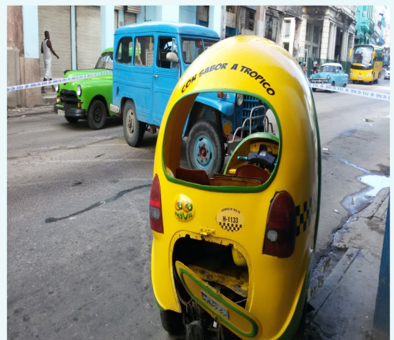
Imagen de los vehículos impactados en el lugar