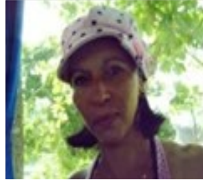
Por: Yamile Bargés Hurtado Periodista Ciudadano