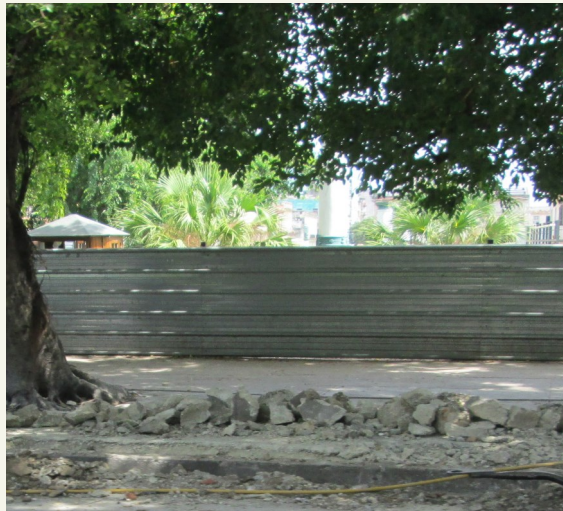
Una de las zonas en la demora para la reparación

Varias vías, en el casco histórico de la capital, continúan siendo afectadas por la empresa de Aguas de la Habana. Estos, con el fin de dar soluciones a las averías en las conductoras del líquido, están creando en la población, descontento e incomodidades. Las personas de edad avanzada, que transitan por las zonas afectadas, en horas de la noche, sienten temor a caer