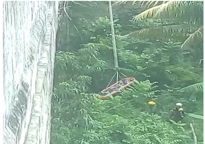
Momento en que los bomberos subían el cadáver

"Yosandry padecía de los nervios y se desesperó cuando vio que la multa ascendió a 10 mil pesos. Y por si fuese poco el dueño le retira el transporte que posiblemente le hubiese ayudado con el pago de la multa. Los dueños de los bici-taxi cuando ven que un conductor es multado lo bajan del transporte y se lo rentan a otra persona para no perder dinero y que la multa la pague el infractor", declaró un conductor de bici-taxi que quiso mantenerse en anonimato.