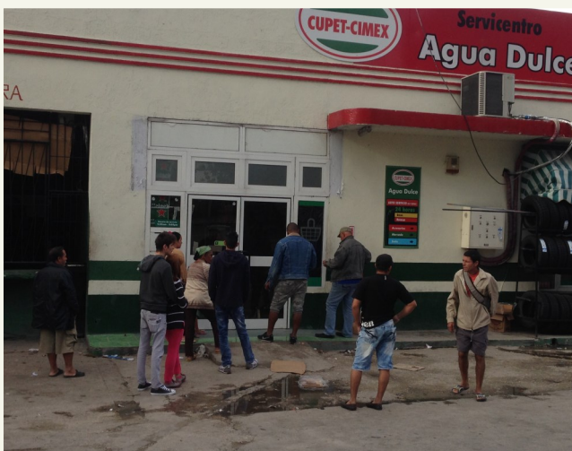
Imagen de la tienda Servicentro Agua Dulce

Habana Vieja, La Habana, (ICLEP). Cierre de dos tiendas dedicadas a la venta de artículos de primera necesidad, y la reducción del horario laboral en otras, ha generado malestar en la población. Esto es debido a la reducción del horario laboral en estos mercados. La medida, dejó a merced de merolicos, intermediarios y del mercado negro a una vasta población de bajos ingresos