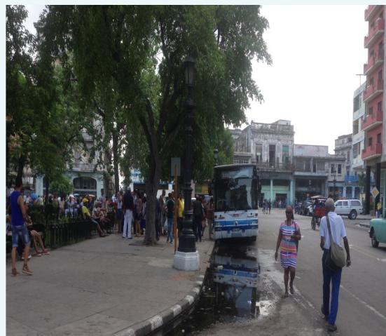
Parada de la ruta 222

"Ese charco de agua podrida es tan familiar y normal como el césped en estos parques, como las hojas mustias que caen de los árboles, como ver llegar la guagua y que te montes en ella" aseguró, en condición de anonimato, a este reportero un chofer de la ruta 222 y sentenció: "en ocasiones los pasajeros suben con los zapatos que ya tu sabes y que vas a hacer, no los puedes bajar".