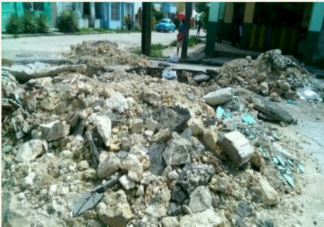
Rotura creada desde el mes de abril

Se mantienen las rupturas de las calles y las dificultades del agua potable en las casas. Transeúntes y vecinos, se muestra indignados. Los responsables de la Empresa de Viales no prestan interés alguno a esta situación.