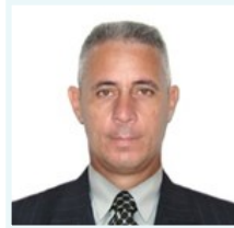
Por: Alejandro Hernández Cepero Periodista Ciudadano

centenar de personas en ambos ómnibus y de otros pasajeros, peatones y conductores de la vía. Eran las 8:29 de la mañana.