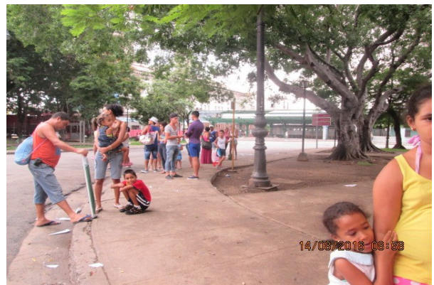
Piquera de taxis hacia las Playas del Este