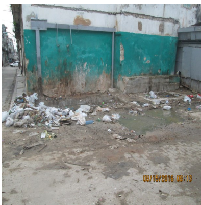
Área de depósito de basura sin los tanques